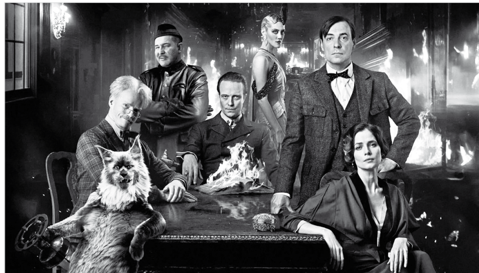
Основной актерский состав фильма

Действия картины начинаются нетрадиционно для экранизаций «Мастера и Маргариты». Нам показывают, как дверь в многоэтажном московском доме 1930-х годов открывается и закрывается сама по себе. Это настораживает дворецкого, который