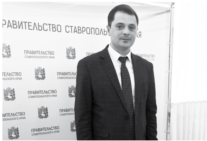
Заместитель министра дорожного хозяйства и транспорта Денис Янаков