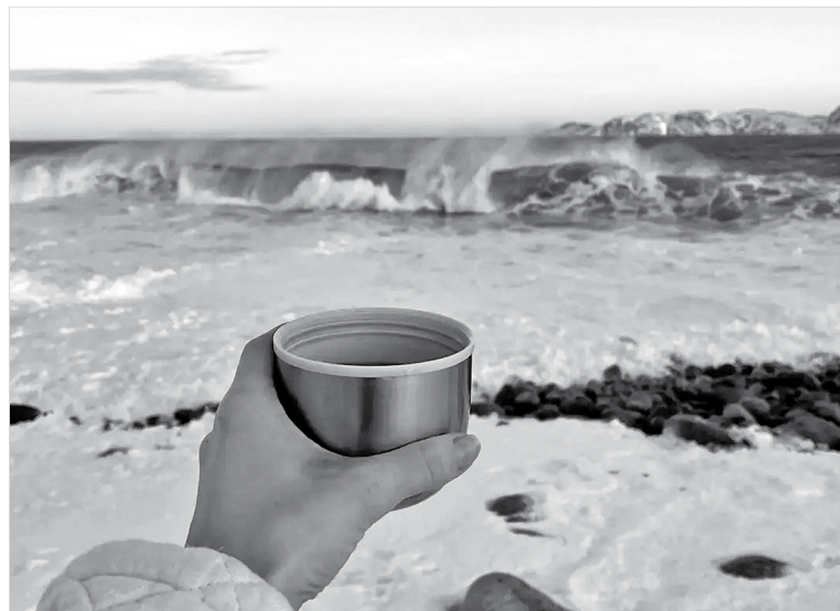
Утро на «Драконьих яйцах»

Посёлок не стал местом паломничества, но поток туристов стабилен, что положительно сказывается и на благоустройстве жилой части посёлка, развитии инфраструктуры и на благосостоянии местного населения. Кроме историко-культурной программы, посещения местных достопримечательностей и заброшенных зданий посёлка, туристам предлагают рыбалку, дайвинг, парашютный спорт.