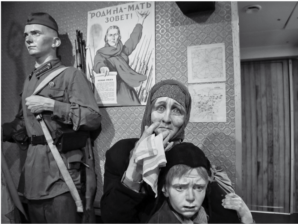
В глазах – весь ужас войны