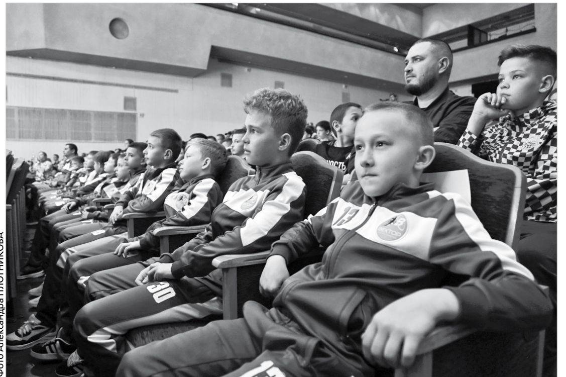
Победители турнира среди игроков 2013 года рождения – ребята из ставропольского «Вектора»