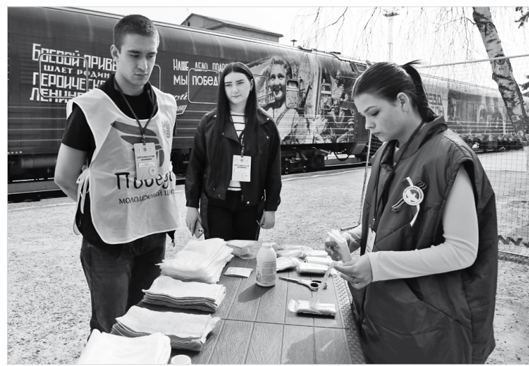
Мастер-класс по изготовлению сухого армейского душа