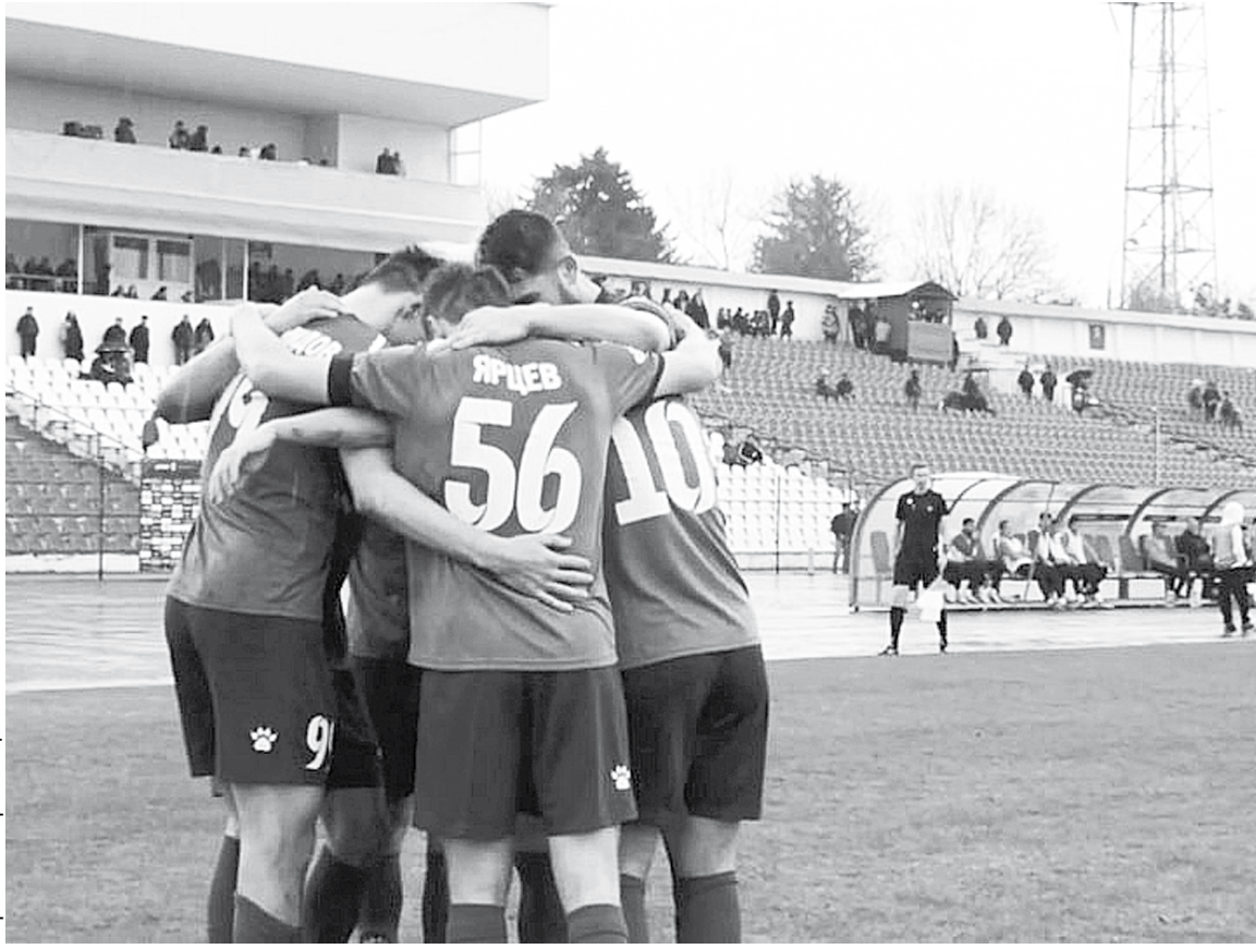
«Динамо» празднуют первый гол сезона 2024 года