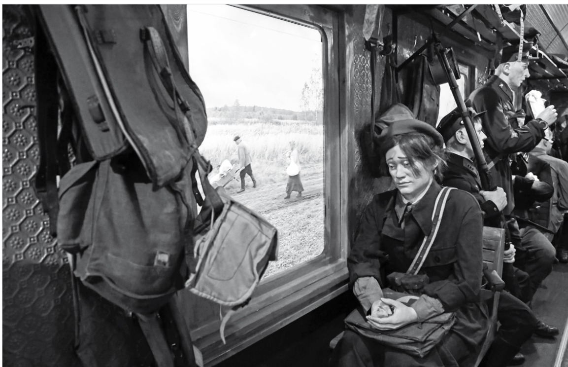
Электричка идет на фронт