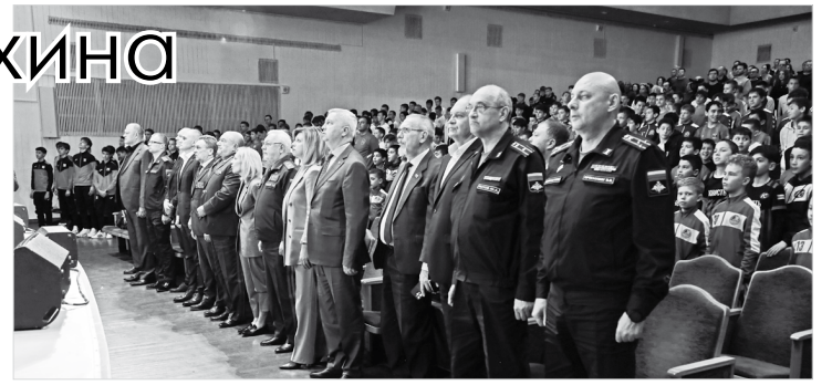
Почетные гости церемонии награждения