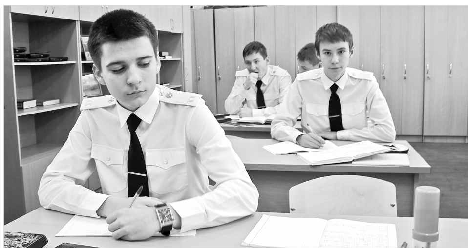
Пересдача ЕГЭ с потерей результатов первого экзамена: стресс или нет?

торовна отметила, что «последние звонки» для выпускников школ края состоятся 25 мая. А выпускные вечера пройдут 28 и 29 июня для девятиклассников и одиннадцатиклассников. Такие поздние даты выбраны неслучайно. Школьники должны уже знать все результаты ЕГЭ и провести выпускной вечер с максимальной радостью, не думая об экзаменах. Также дополнительные дни подготовки к ответственному событию получают родители выпускников.