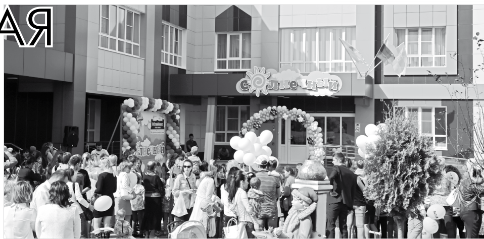
Доступность детсадов на Ставрополье равна 100%

Следующей темой брифинга стали самые важные радостные мероприятия для старшеклассников региона. Мария Вик-