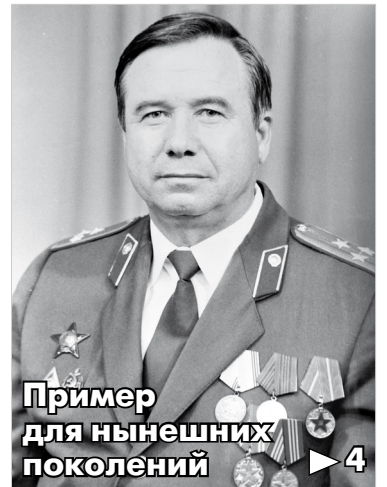
Пример для нынешних поколений ▶ 4