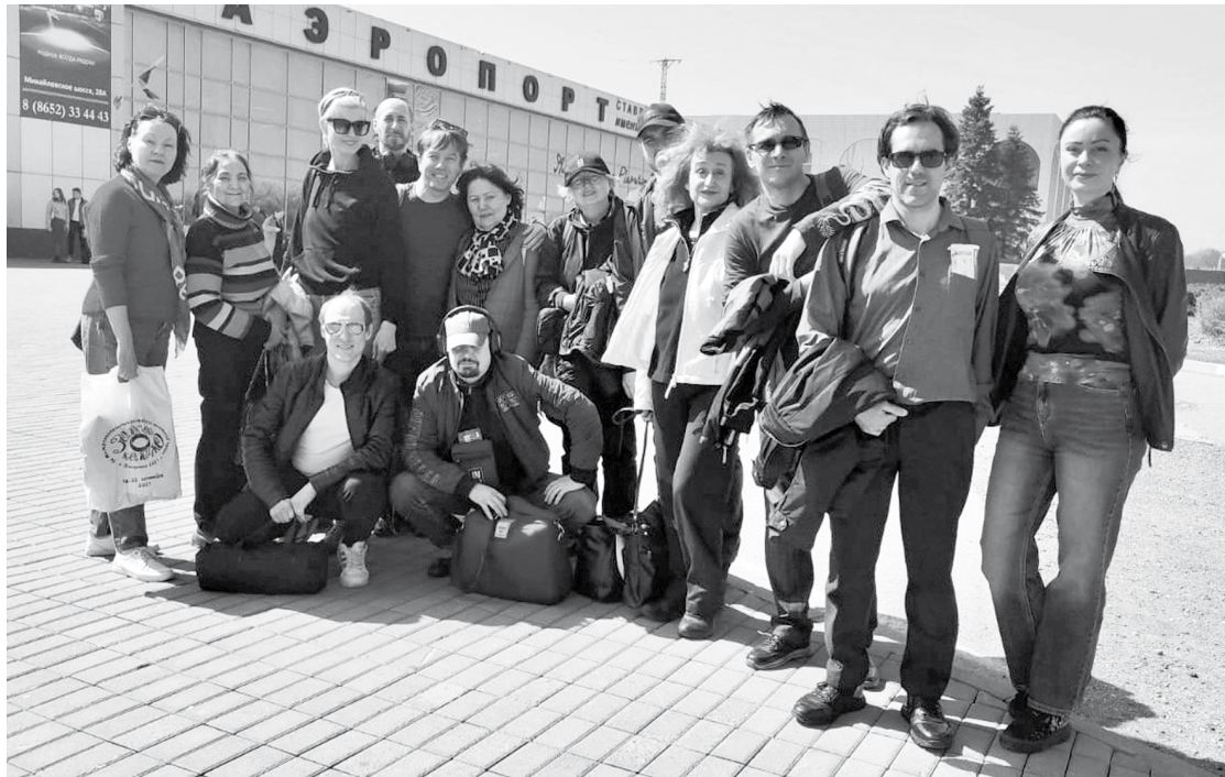
Ставрополь встретил гостей солнцем и ветром