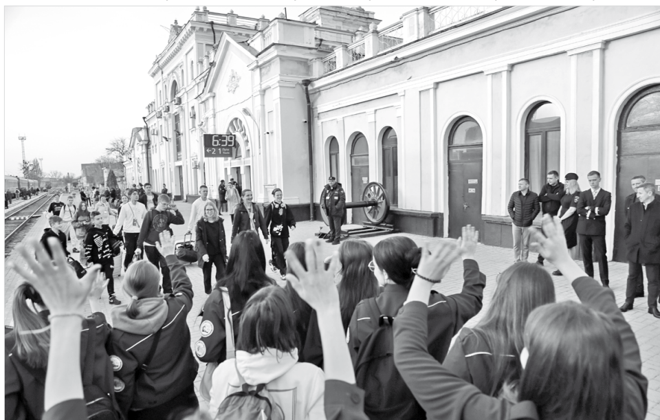
Так в Ставрополе встречали детей из Белгорода

Геннадий КРИШТОФОРОВ