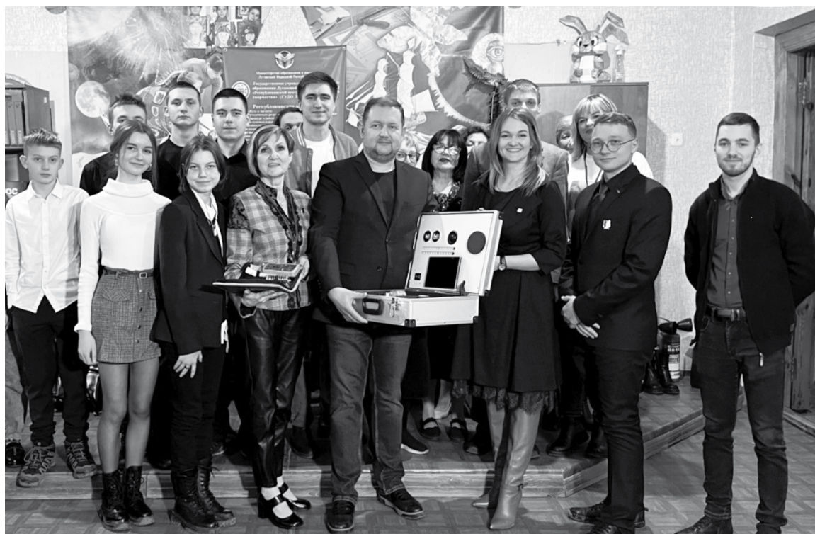
Несмотря на трудности, дети Луганска мечтают о будущем