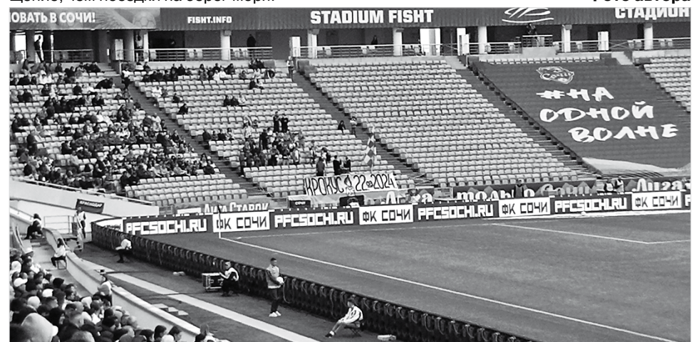
На стадионе «Фишт»

Несмотря на относительно небольшое количество зрителей, на матче было очевидно, что футбол в Сочи любят. И очень жаль, что клуб сейчас находится на последней строчке турнирной таблицы, и спасти его от вылета в низший дивизион, похоже, сможет только чудо. Кстати, именно этот факт несколько примирил меня с не очень-то хорошим для армейцев результатом. Кто знает, может, это самое добытое в борьбе очко и поможет сочинцам зацепиться за место в Премьер-лиге. Пусть так и будет, иначе такой замечательный выезд станет для меня близких по расстоянию от нашего города Ростове-на-Дону и Краснодаре, при всем к ним уважении, оставляют совсем не то ощущение, чем поездки на берег моря.