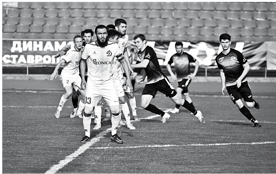
«Динамо» готовятся к штрафному соперника

Стало ясно, что игра пойдет до гола. Кто забьет первый мяч, тот получит определенное преимущество. Полумоменты и подходы к чужим воротам были чаще у «динамовцев». Очередная такая ситуация возникла на правом фланге на 26-й мину-