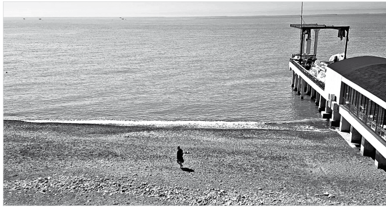
Вид на море из окна отеля