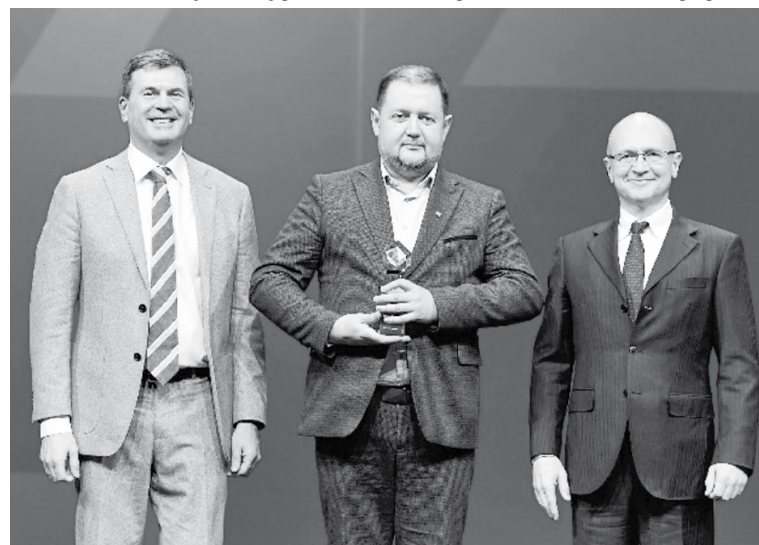
Церемония награждения победителей конкурса «Лидеры России»

- Самый важный тренд сегодняшнего дня звучит так: быть полезным людям и служить России. Его задали наставники и организаторы конкурса,