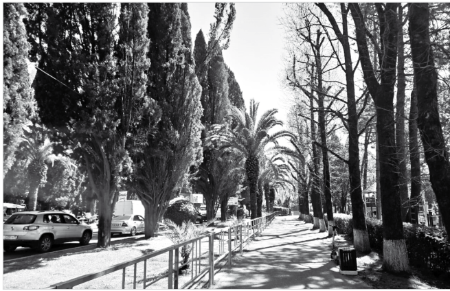
Аллея с пальмами и кипарисами в старом Адлере