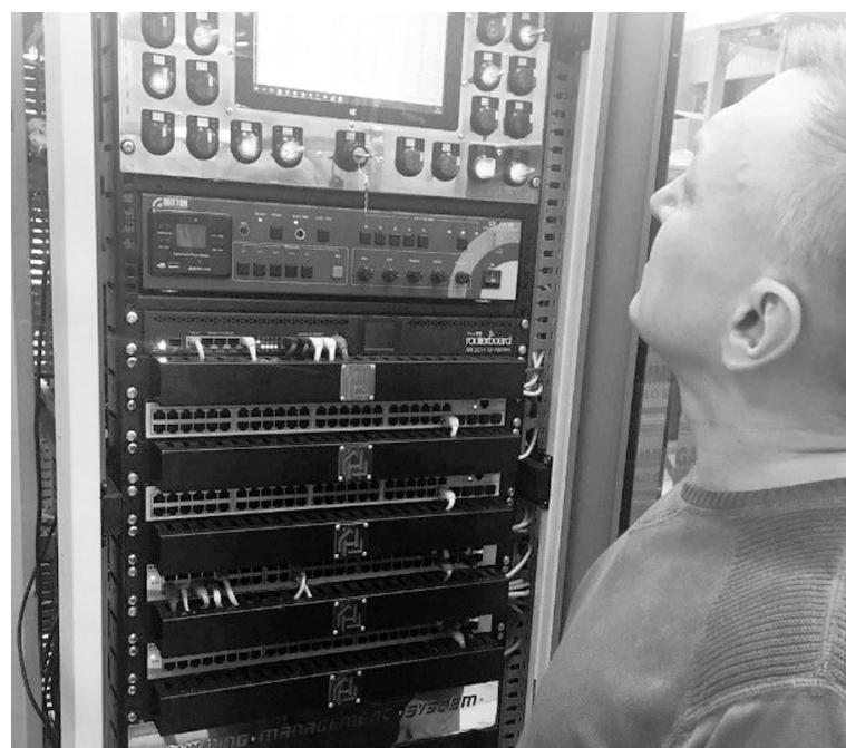
Часть аппаратно-программного комплекса «Киберлицей»