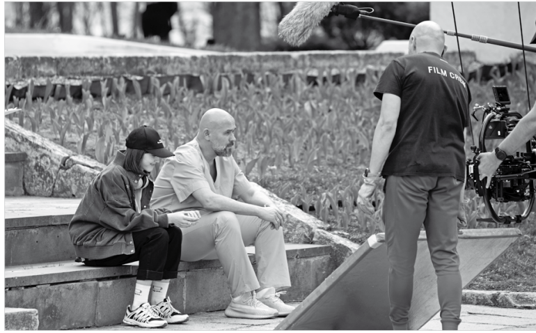
Главной площадкой в Кисловодске стал санаторий имени Орджоникидзе