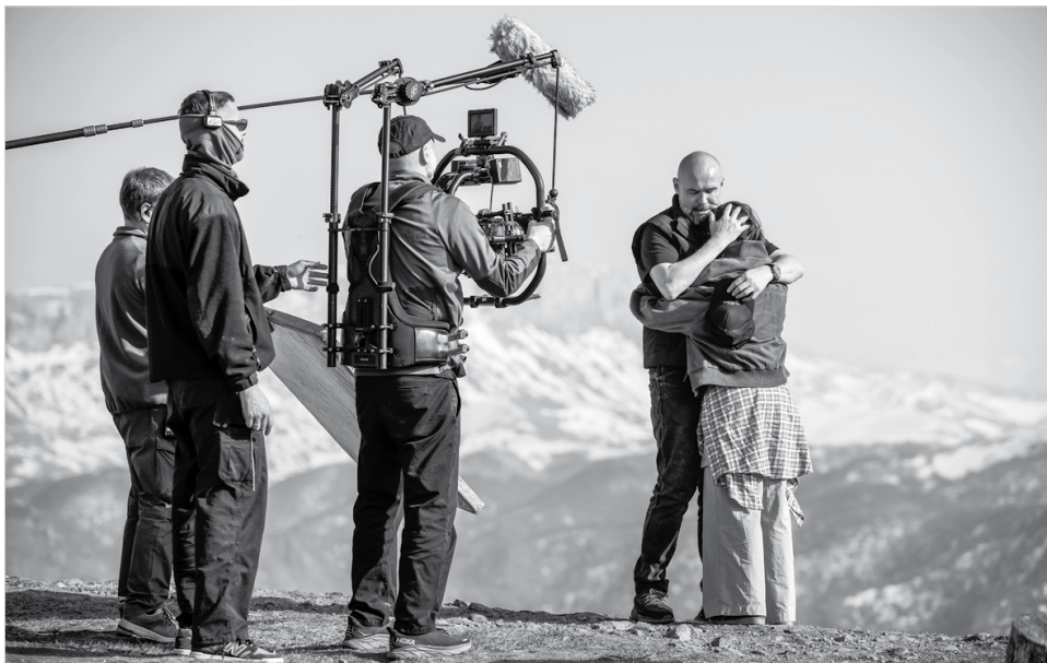
На съемках в урочище Джилы-Су хотела попасть вся творческая группа

В Кисловодске прошли съемки нескольких эпизодов 12-го сезона сериала «Склифосовский» производства кинокомпании «РУССКОЕ» по заказу телеканала «Россия».