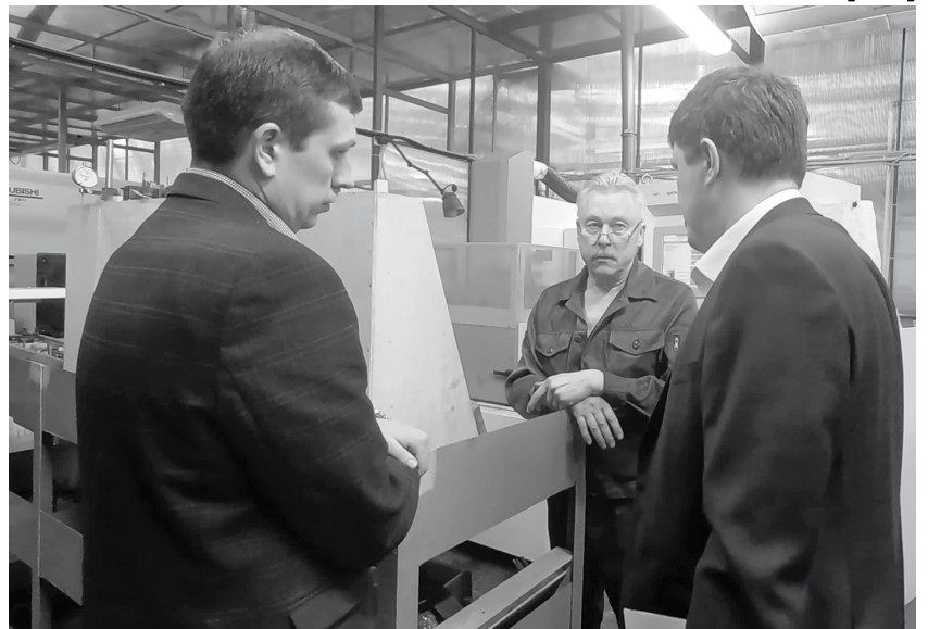
Преподаватели аграрного университета общаются с рабочим