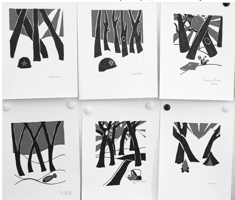
Такие работы создали юные художники из Михайловска на конкурсе

Действительно, самым сложным в интересном творческом задании оказалось ограничение