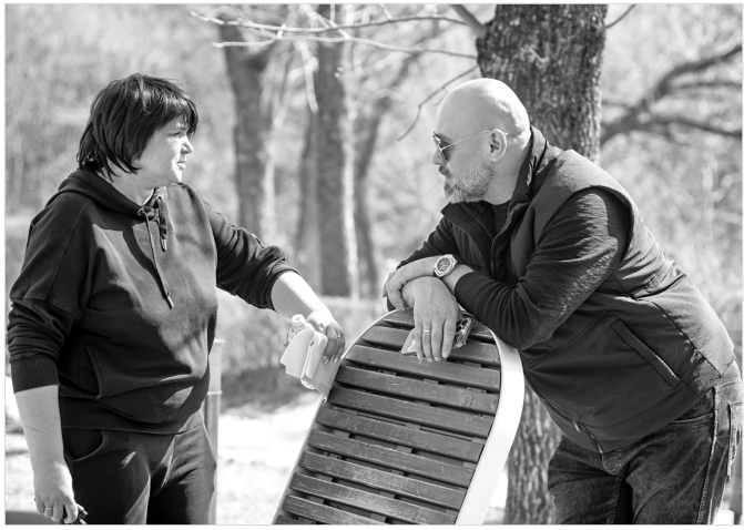
Режиссер Юлия Краснова и актер Максим Аверин