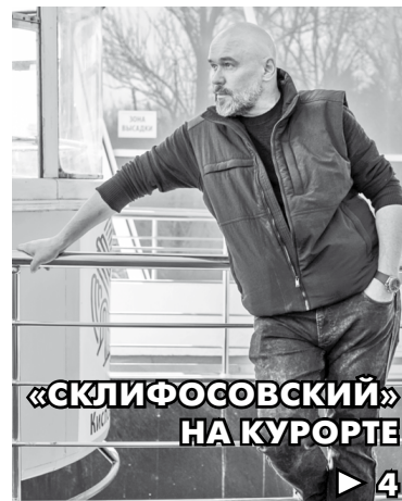
«СКЛИФОСОВСКИЙ» НА КУРОРТЕ