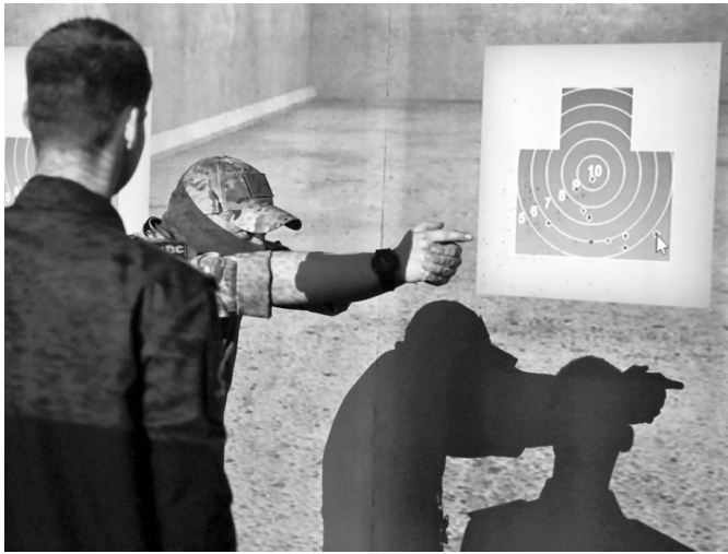
Спортивный двуручный хват пистолета даже в боевых условиях является самым результативным