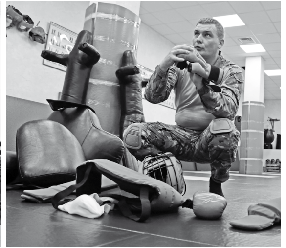
О технике рукопашного боя