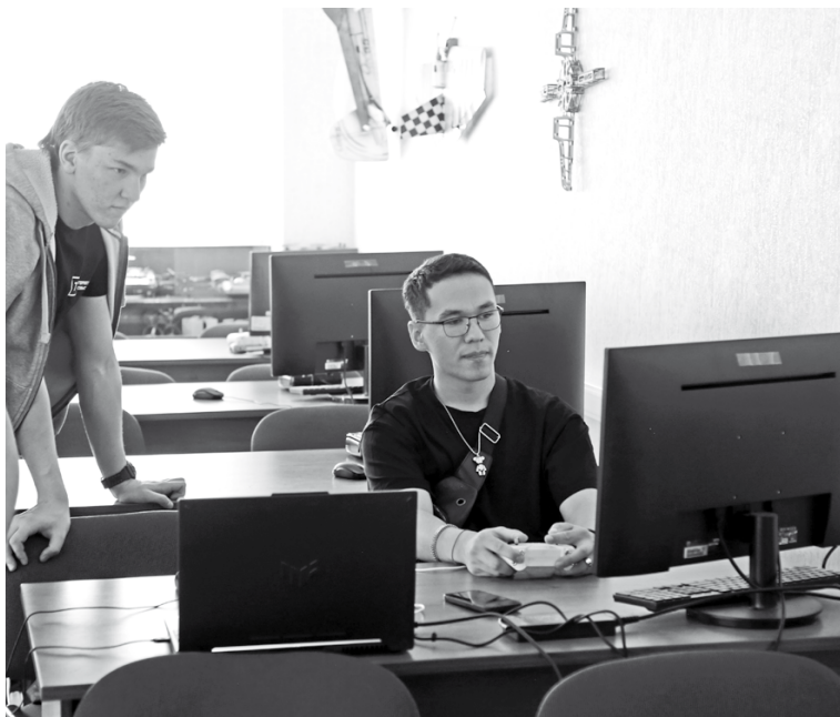
Ребята сами учились управлять беспилотниками через компьютер