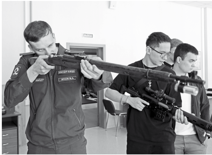
Ребятам из СКФУ было интересно «примериться» к оружию