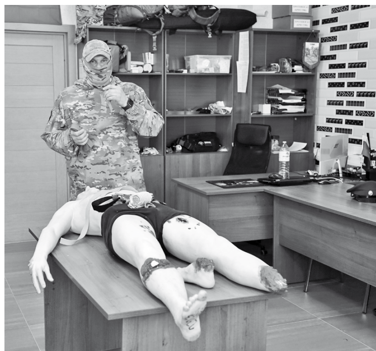
Занятия по тактической медицине

вавшейся публике «малыша». Так он ласково назвал маленький 200-граммовый квадрокоптер – весьма умную машинку, которая к дистанционным командам относилась весьма избирательно. Послушно поднимаясь, опускаясь, двигаясь взад и вперед, она намертво замирала за пару метров от стены, несмотря на команду двигаться вперед. Управлять этим квадрокоптером, оказывается, можно научиться за день. На то, чтобы научиться вести на нем съемку, нужно гораздо больше времени. Но спектр действия «малыша» ограничен. Выше 500 метров его не поднять, и дальность полета его невелика – не говоря уж о дальности видения. Не то что у дронов-разведчиков, которые и нами, и противником очень активно применяются. Были продемонстрированы кадры передвижения к укрытиям подразделения ВСУ. Украинских солдат видно как на ладони. А они ничего не видели и не могли. Ибо съемка велась с беспилотника – с расстояния 7,5 километра. Потом по заданным координатам отработала артиллерия.