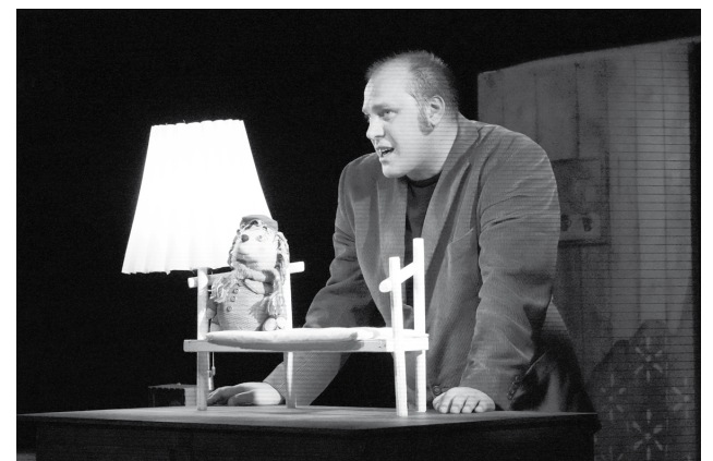
Сцена из спектакля «Домашний ёж»