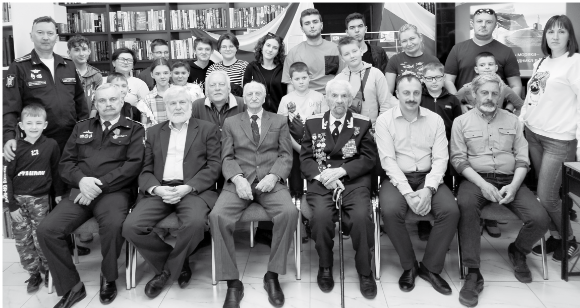
Участники встречи в кают-компании