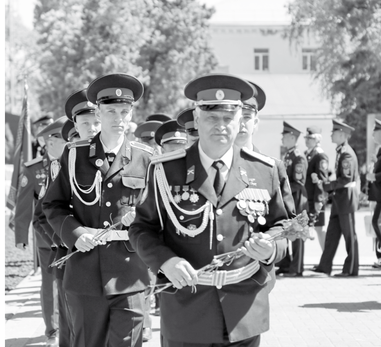
Церемония открытия началась с возложения цветов

города. Надеется, что Ставрополь принесет его команде удачу. «Мы, — говорит он, — много раз участвовали в этом конкурсе и через раз побеждали».