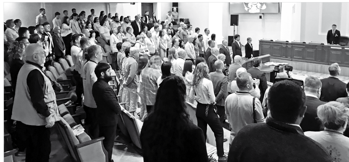
Открытие пленарного заседания