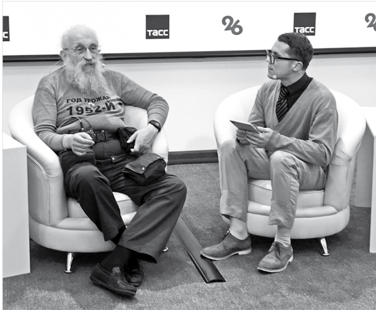
Анатолий Вассерман на пресс-конференции в РИЦ СК

Перед пресс-конференцией Анатолий Вассерман посетил библиотеку СтГАУ. Журналиста приятно удивило, что студенты работают с бумажными книгами. Он признался, что ему постепен-