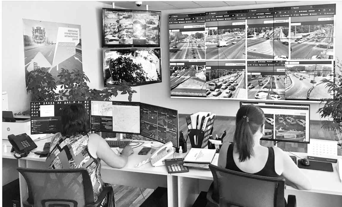
«Видеостена» в Центре организации дорожного движения города Ставрополя

– Главная цель появления в нашем городе Центра организации дорожного движения заключается в оптимизации автомо-