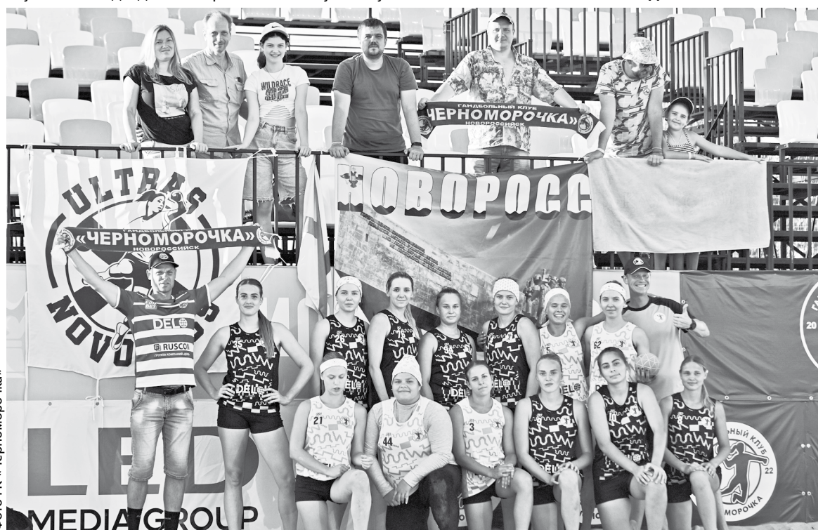
Фото ТК «Черноморочка»