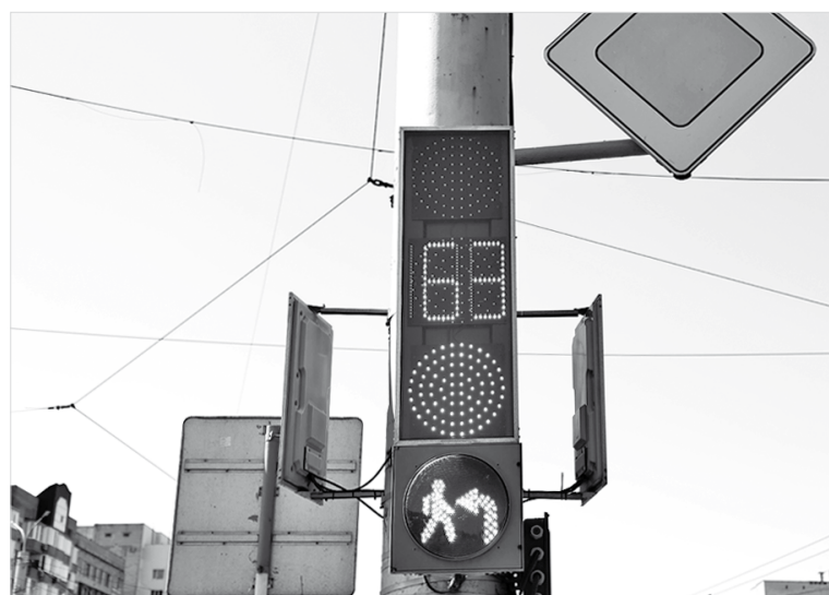
Еще не все светофоры «поумнели», но современных комплексов становится все больше

Мы общались с руководителем «Трансигнала» в том помещении, где находится оборудованная мониторами «видеостена». Впечатления были потрясающими. Казалось, что перед взором открываются если не все, то очень многие проблемные места на перекрестках краевой столицы. Опытные девушки-диспетчеры прекрасно со всем этим справляются, в зависимости от ситуации меняя фазы работы светофоров. Проблемные моменты чаще всего