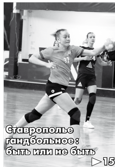
Ставрополье гандбольное: быть или не быть

Что касается воды, то каждые 10 дней проверяет Роспотребнадзор.