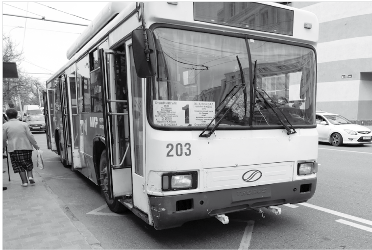
Ставропольский троллейбус на работе

В 2008 году троллейбусный парк начинает уходить в глубокое пике. Предприятие переходит в частные руки. В марте завершает свое курсирование по городу маршрут №11, который за два года до этого был продлен до ж/д вокзала. В салонах троллейбусов реже появляются кондукторы. Руководству акционерного общества просто невыгодно содержать