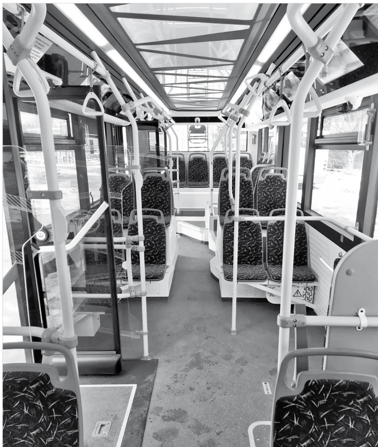
Возможный вариант оформления салона в новых троллейбусах

этих сотрудников, ведь оплачивать проезд пассажиры могут и у водителя. 18 декабря того же года попытались возобновить маршрут №6, но это была уже агония. Он просуществовал ровно один день и вновь был отменен. Все действия в 2008 году привели к тому, что впервые в истории города троллейбусы не вышли на работу во время новогодних праздников. «Каникулы» были лишь предвестником беды. 2 февраля 2009 года в связи с долгами за электроэнергию отключается тяговая подстанция. Поэтому маршрут №9 был отменен, «семерка» начала ходить до СтавНИИГиМа, а «единичка», «двойка» и «четверка» доезжали только до бывшего кинотеатра «Родина». Конечно же, в ситуацию вмешались власти. С их помощью удалось в марте отменить все ограничения, а уже в декабре троллейбусный парк вновь перешел под крыло местной власти.