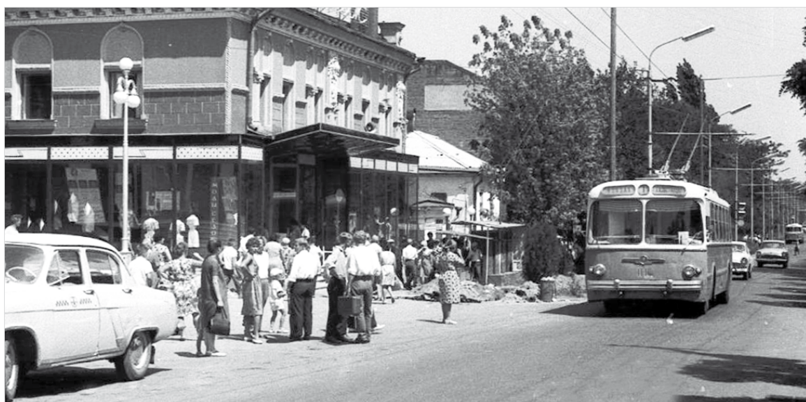
Ставрополь. Июнь 1966 г.

24 июля 1964 года на улицы Ставрополя вышел новый вид общественного транспорта, который до сих пор любят как взрослые, так и дети. Речь идет о троллейбусе. «Рогатые» уже стали неотъемлемой частью нашего города. Так давайте же узнаем чуть больше об этом прекрасном транспорте.