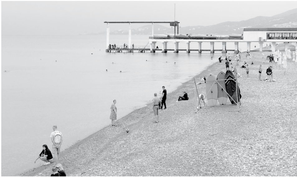
Море в октябре