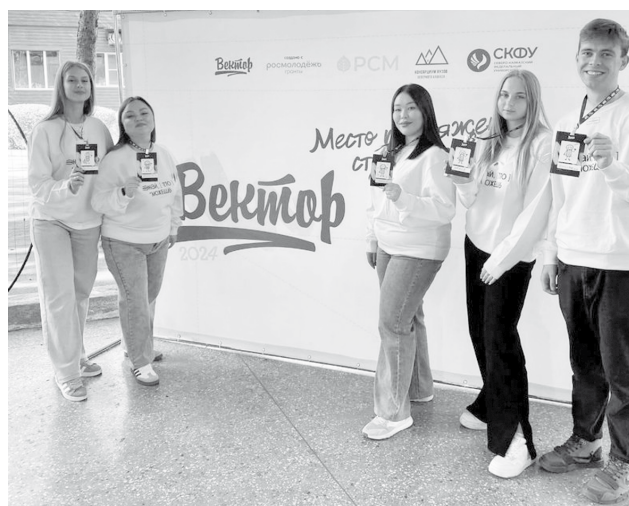
Студенты СГПИ – участники форума