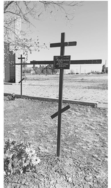
Неизвестный солдат Новороссии похоронен возле воинского мемориала Дьяково

– Нет, дроны в войска поступают. Другое дело, что в условиях нынешней войны их нужно все больше и больше. И волонтеры действительно очень помогают. Большое спасибо всем им. Оперделение «война дронов» – это