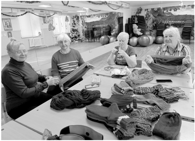
Гостинцы для защитников