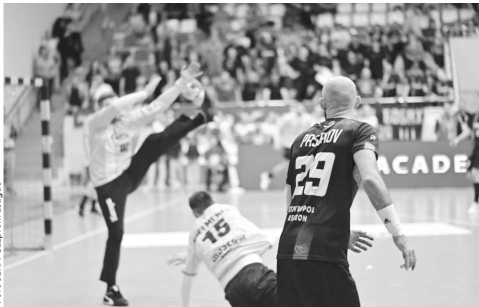
Пенальти «Виктора» стали ключевым фактором поражения

Команды начали встречу в Буденновске с похожих комбинаций, которые завершились голами. Совпадения длились только две минуты. В победном матче против «Чеховских медведей» в Ставрополе «викторианцы» противодействовали активной обороне соперника с помощью скорости и прорезок полусредних. В Буденновске го-