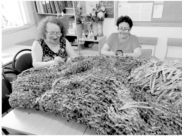
Маскировочные сети – покров материнский