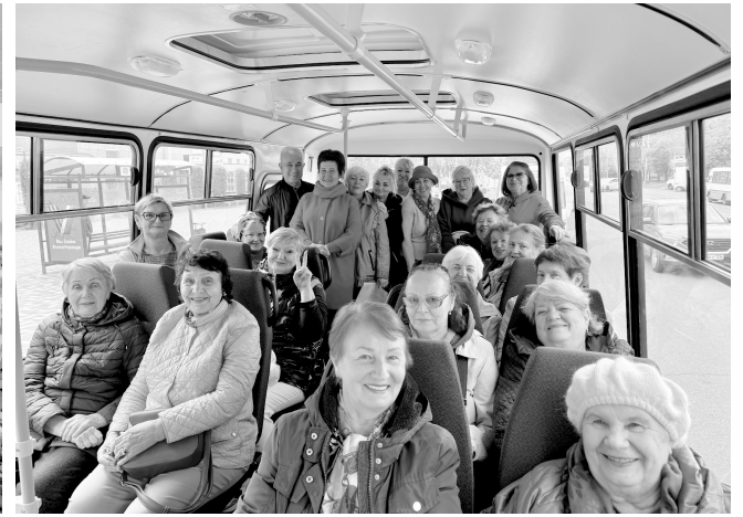
Совсем как в песне: «Старость меня дома не застанет!»