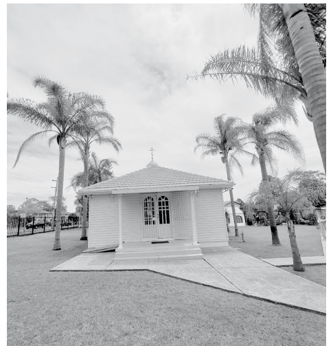
Православный храм под австралийскими пальмами