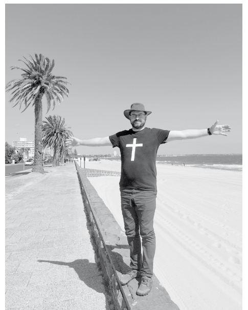
В Австралии сейчас весна