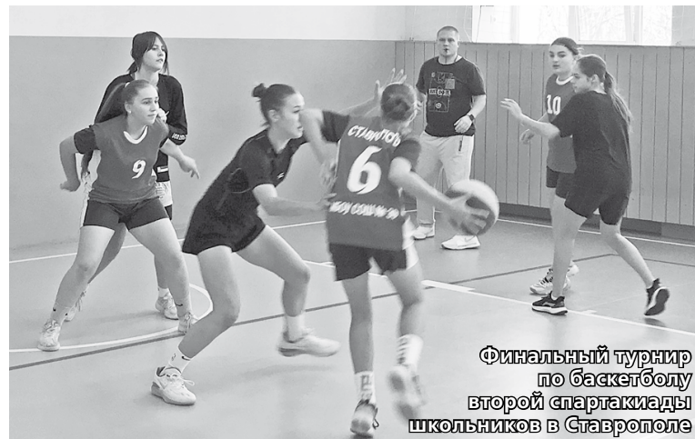
Финальный турнир по баскетболу второй спартакиады школьников в Ставрополе

Стоит напомнить, что в прошлом году в первой подобной спартакиаде приняли участие 44 городские школы. Тогда более 30 тысяч ребят боролись за призовые места в десяти видах спорта. В этом сезоне и количество участ-