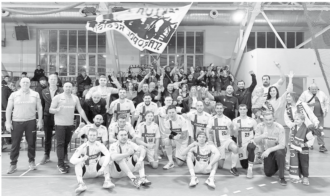
«Викторианцы» не остались в Волгограде без поддержки

Игроки «КАУСТИКА» не предлагали в обороне сложных построений. Их легко можно было взламывать качественными комбинациями. А вот с этим у гостей