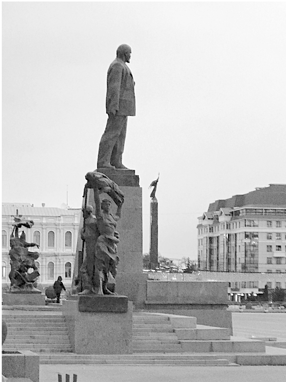
Памятник Ленину на центральной площади Ставрополя

Справедливости ради надо сказать, что революционная вакханалия через какое-то время пошла на спад. Здесь свою роль сыграла начавшая уже покойным предсе-