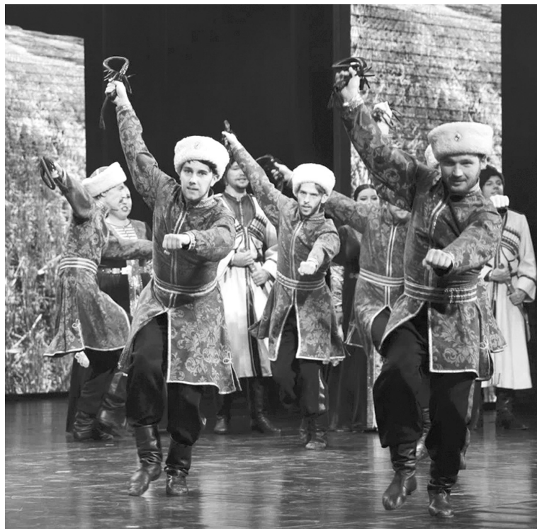
Лихой казачий танец

песни и прекрасное исполнение усиливали в зрительском восприятии видеоряд с изображением улиц, памятников Ставрополя и его видов с высоты птичьего полета – утопающего в зелени и светящегося в ночное время иллюминацией, издали похожей на праздничное убранство. И в