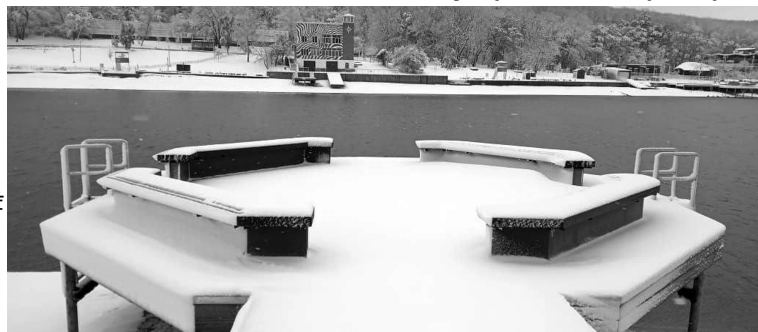
В ноябре снег погрузил Ставрополь в новогоднюю сказку