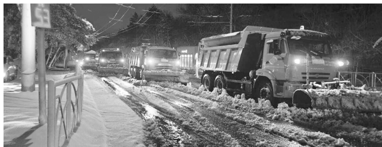
Техника убирает снег с дорог города