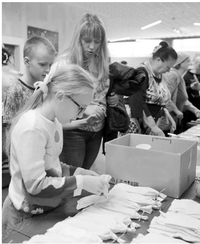
Мастер-класс для зрителей