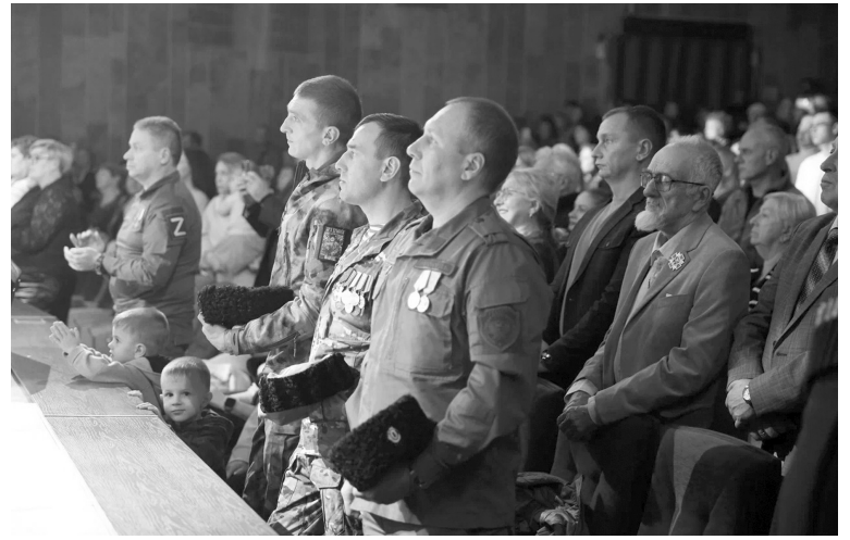
Почетными гостями фестиваля были участники спецоперации