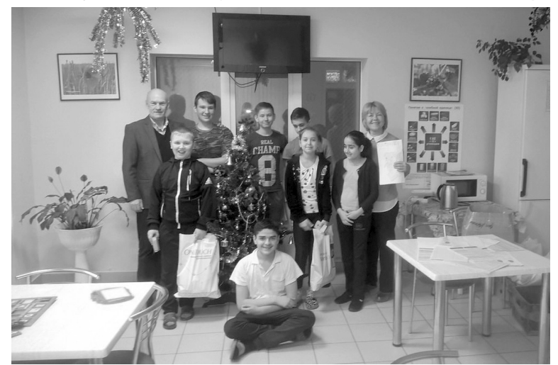
С детьми в горбольнице Ставрополя несколько лет назад