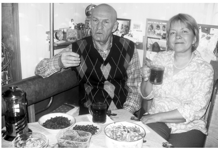
Питание должно быть полезным