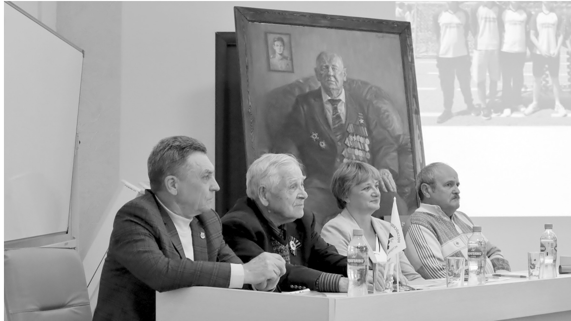
Почетные гости конференции

История Российской государственности насчитывает более тысячи лет. Киевская Русь, Московское царство, Российская империя, Союз Советских Социалистических Республик, Российская Федерация – это все этапы становления и развития нашего государства. Россия – это одновременно и европейская, и азиатская держава. Поэтому, с одной стороны, именно здесь происходили взаимопроникновение и взаимодействие европейской и азиатской культуры и складывалась самобытная цивилизация, а с другой – за всю историю практически не было для нашей страны спокойного и мирного времени. Приходилось обороняться от многочисленных врагов, жаждущих захватить нашу Родину.