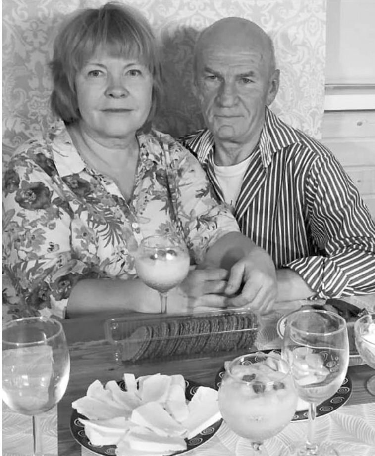
Руководители диабетического просвещения десерт на ужин готовят только сами, и никакого сахара и хлеба