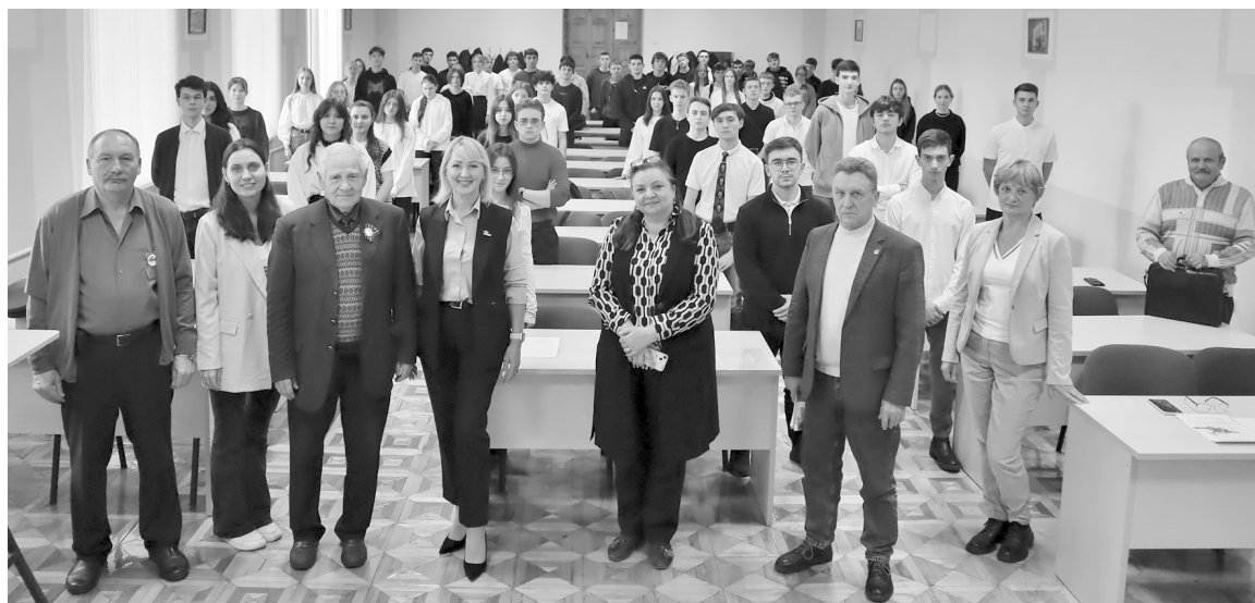
Общий снимок на память