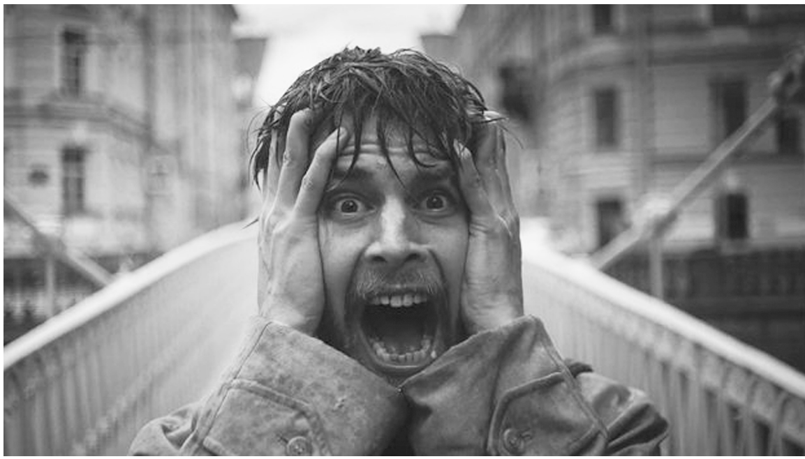
Игра Ивана Янковского отражает весь ужас сериала

Обозначу сразу – сериал Владимира Мирзоева «Пре-