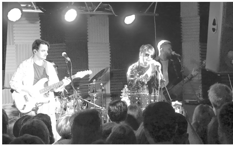
Группа «Аффинаж» на концерте в Ставрополе

го уровня не так уж часто балуют ставропольского зрителя. Но, как говорится, получилось, как получилось.