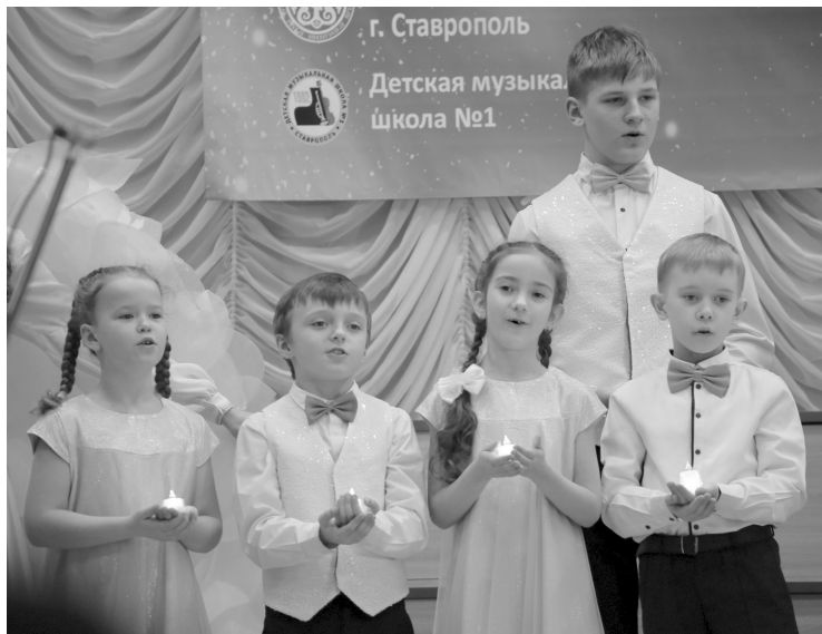
В эти дни голоса самых юных исполнителей звучат по-особому