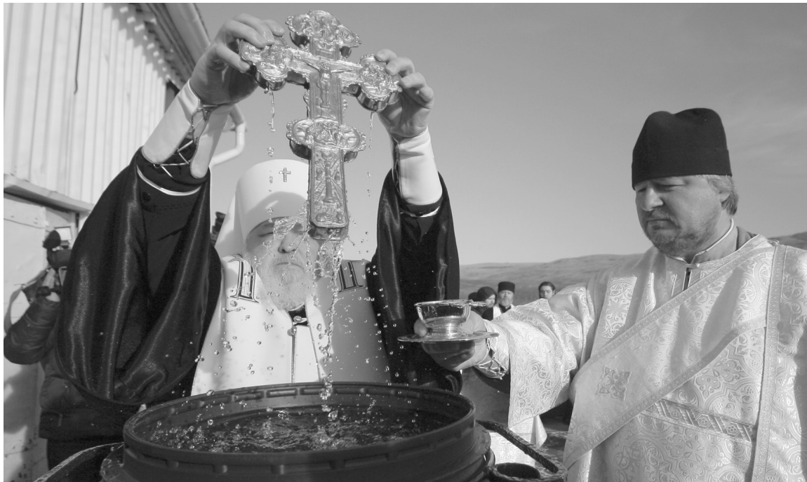
Митрополит Кирилл традиционно освящает воду Сенгилеевского водохранилища

В день Крещения Господня люди идут в храмы, захватив с собой емкости, чтобы набрать в них святой воды. Здесь есть прямая связь. В Евангелии описано, как тридцатилетний Иисус Христос пришел к реке Иордан, где Иоанн Предтеча призывал людей покаяться и очиститься от грехов, совершив омовение в водах, считавшихся священными. Там пророк и окрестил Иисуса Христа, что стало важнейшим событием в его зем-