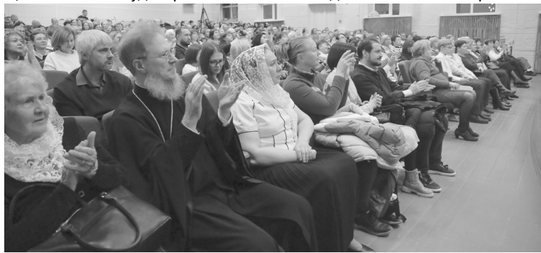
Рождественский фестиваль собрал полный зал зрителей