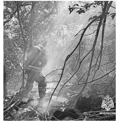
Для предотвращения пожаров на Бештау усилена группировка МЧС

– Я знаю, что такое стена огня. Когда у нас загорелось поле, и ветер нес огонь со скоростью 25 метров в секунду. Эту стихию никто не остановит, хоть все мы встанем на пути.