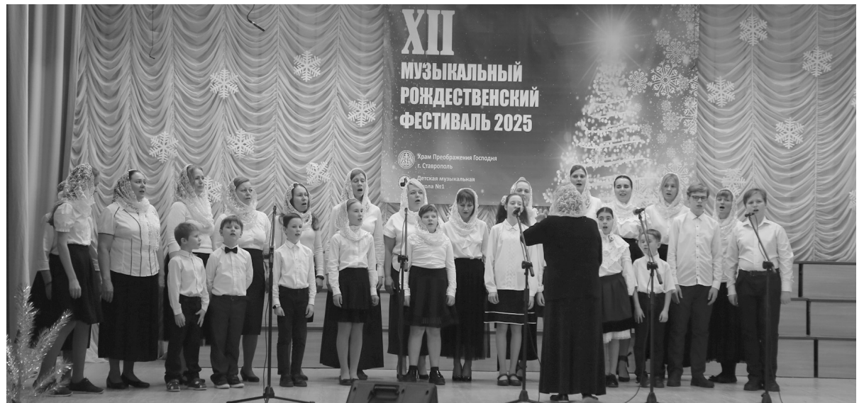
«Звездный хор к иному хору слухом трепетным приник»

XII музыкальный Рождественский фестиваль, организованный под эгидой храма Преображения Господня и детской музыкальной школы №1 Ставрополя при участии концертного агентства Евгении Хановой, 15 января собрал ценителей духовной музыки. Местом его проведения стала ДМШ №1, расположенная в старинном особняке XIX века в самом сердце Ставрополя на улице Дзержинского. Каждый год это музыкальное событие объединяет в нашем городе творческих людей – детей и взрослых, учащихся детских музыкальных учреждений и школ искусств и, конечно, их наставников.