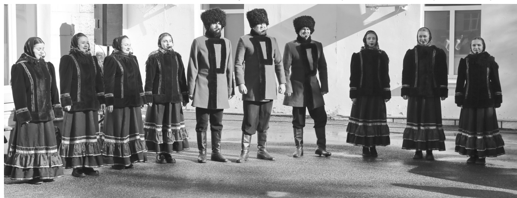
Гостей праздника встречали артисты ансамбля песни терских казаков «Наследие»

Геннадий КРИШТОФОРОВ.