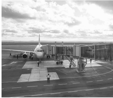
Новый терминал в аэропорту Ставрополя уже принимает пассажиров

Новый терминал в Ставрополе уже запущен в эксплуатацию, в Мин. Водах это вот-вот случится. Следующий этап – реконструкция взлетно-посадочных полос. Деньги на масштабные работы