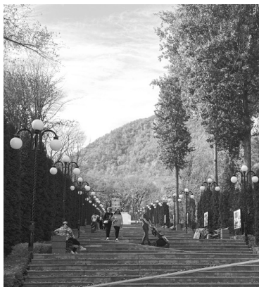
За счет курортного сбора в крае сделано очень много

С 1 января этого года курсбор отменен, вместо него начнут собирать турналог. Разница в том, что сбор платили сами отдыхающие, приехавшие в наш край. А налог переложили на плечи организаций размещения. И мы, конечно, не удивимся, когда отели и санатории поднимут стоимость своих услуг, мотивируя это новым налогом. Но проблема даже не в этом, а в том, что теперь деньги