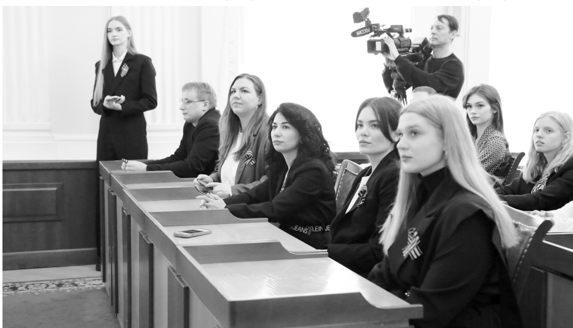
Победители конкурса молодежных социальных инициатив

ть здоровья крепкого, мирного неба над головой и чтобы все задуманные идеи и проекты всегда реализовывались.