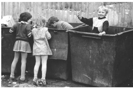
Ставрополь, гостиница «Интурист», 1991 г.