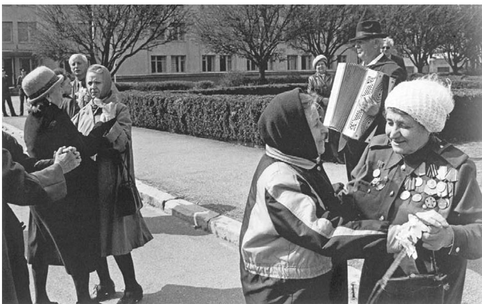
Из серии «Праздник» (Ставрополь, площадь Ленина, 1995 г.)