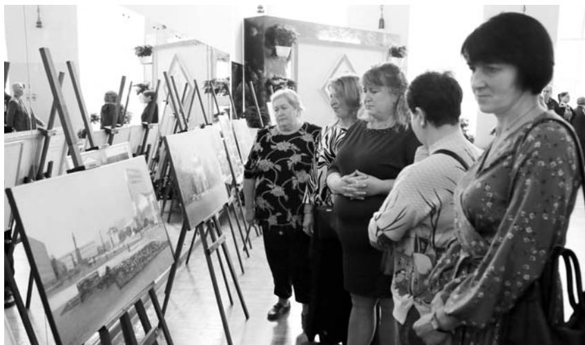
Каждый гость мероприятия мог увидеть фотовыставку с работами ставропольских озеленителей