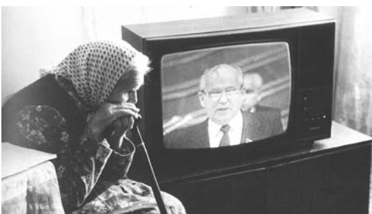
Из серии «Ставрополь, дом-интернат для инвалидов и престарелых, 1990 г.»