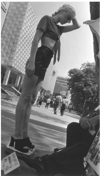
Ставрополь, ул. Дзержинского, 184, ЦУМ, 1995 г.