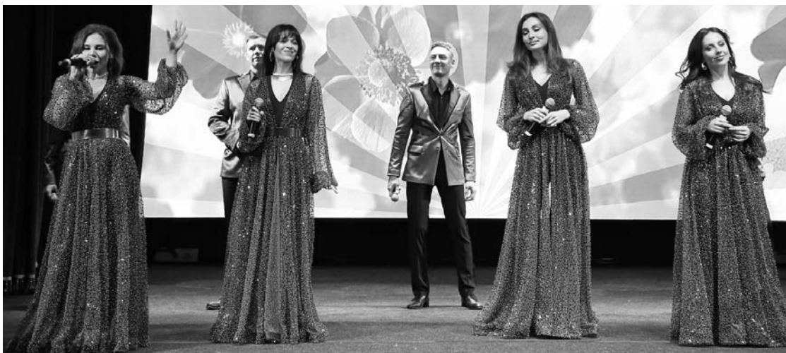
Творческие номера подарили юбилярам городские артисты и студенческие коллективы