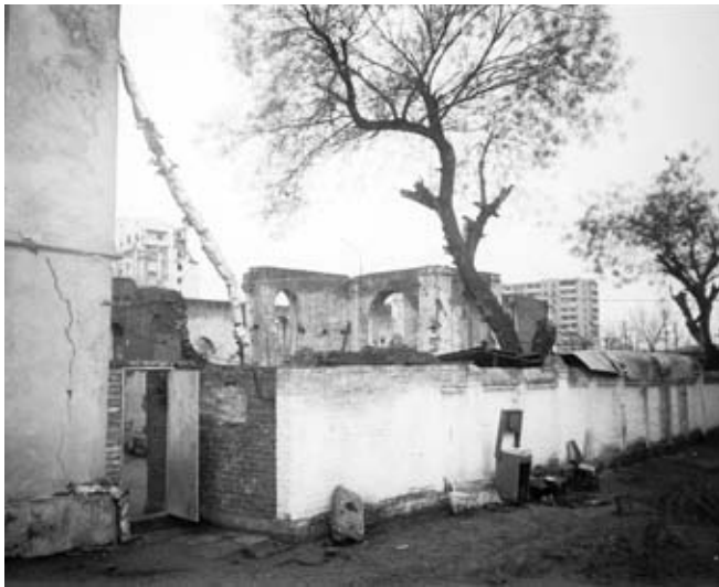
В 2004 году храм в Грозном выглядел так