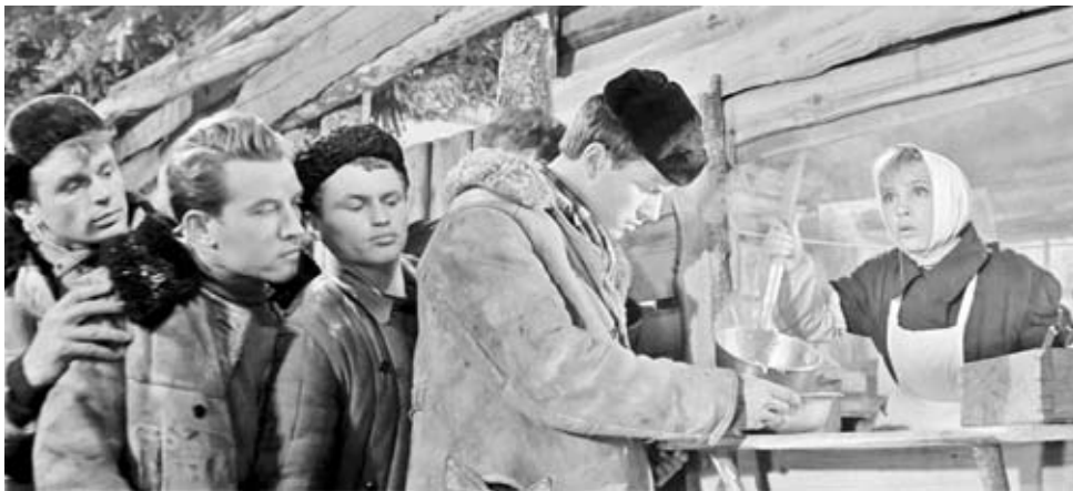
Кадр из фильма «Девчата» (1961)

Молодому поколению не знаком этот вопрос – кто тут крайний? А те, кто прошел советские будни, помнит, что, подходя к магазину любого профиля и видя там столпотворение людей, первым задавали вопрос: «А кто тут крайний?», и уж затем: «А что тут дают?».