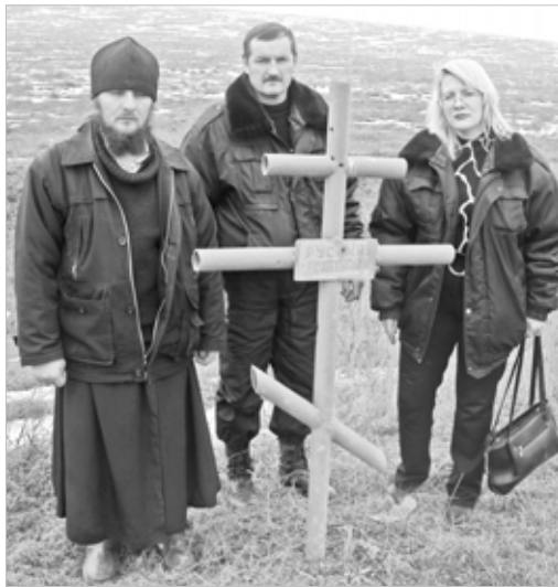
Поклонный крест у Петропавловской

Я часто вспоминаю, как она сказала в первую нашу встречу: «Как такое может происходить, чтобы жить в своей стране и у тебя все отняли, все разрушили... Что осталось – чужой город и кладбище, где лежат родные люди».