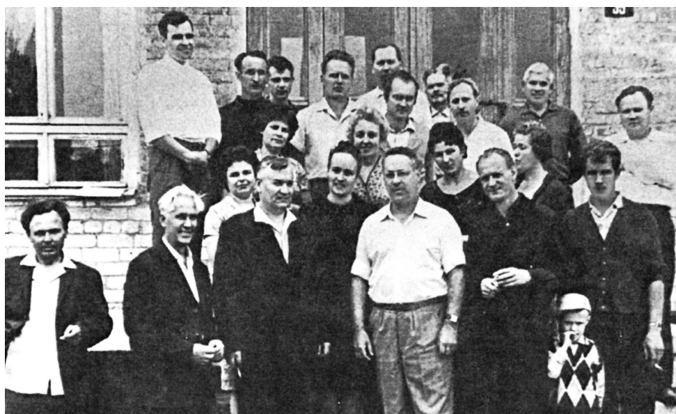
В гостях у журналистов краевого радио диктор Ю. Левитан, 1967 г.

К 1 января 1948 года количество радиотрансляционных точек на Ставропо-