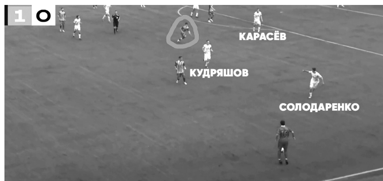
Солодаренко подсказывает партнерам, кого нужно закрыть, кого нужно игнорировать