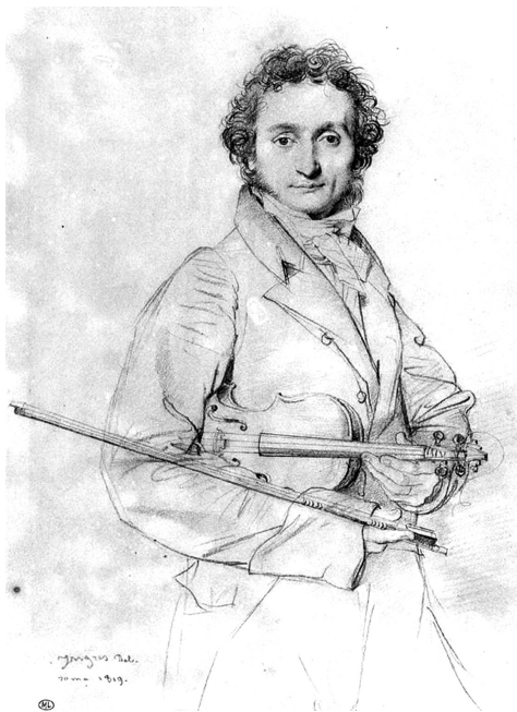
Николо Паганини, 1819. Автор рисунка Ж. Энгр

Петр Ильич Чайковский – еще один гениальный композитор, чьи выдающиеся