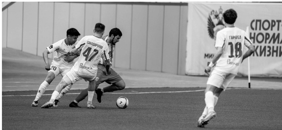
«Динамо» пришлось очень трудно играть против «Алании» в первом тайме