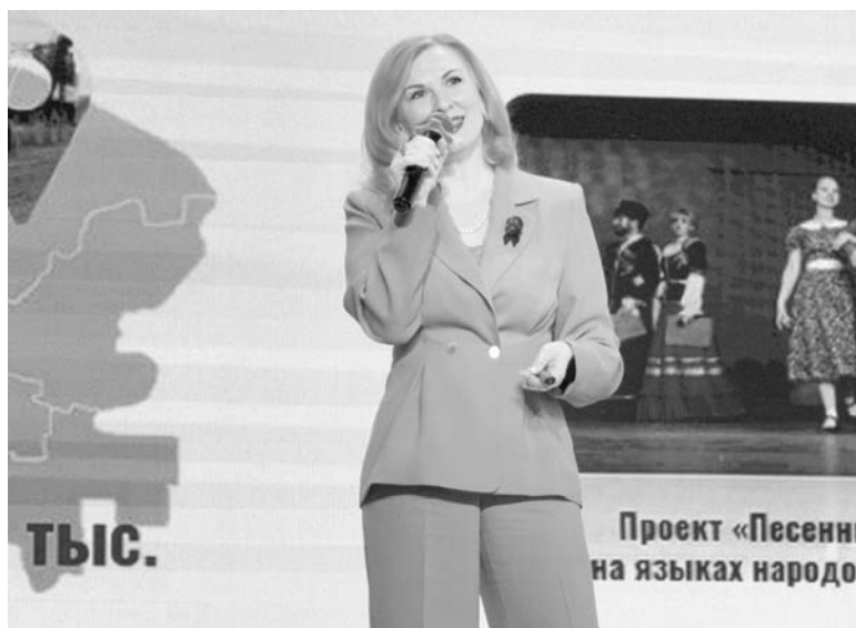
Министр образования Ставропольского края Мария Смагина