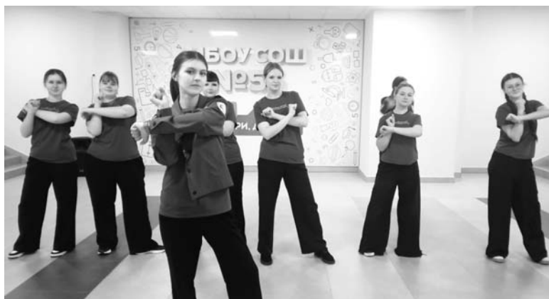
Педагогический отряд «РИТМ» отвечал за досуг