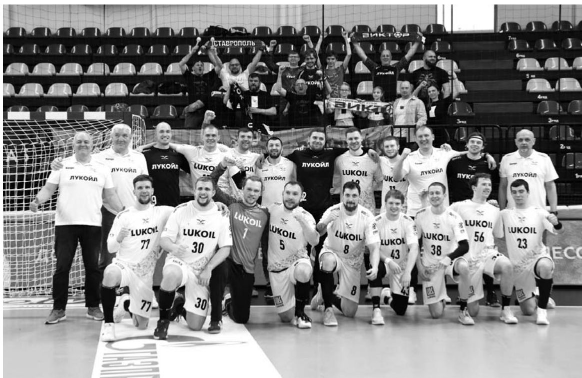
«Виктор» не остался без поддержки болельщиков в Чехове

К последней десяти минутке команды забросили на двоих 20 мячей, распределив их между собой поровну. И именно в этот