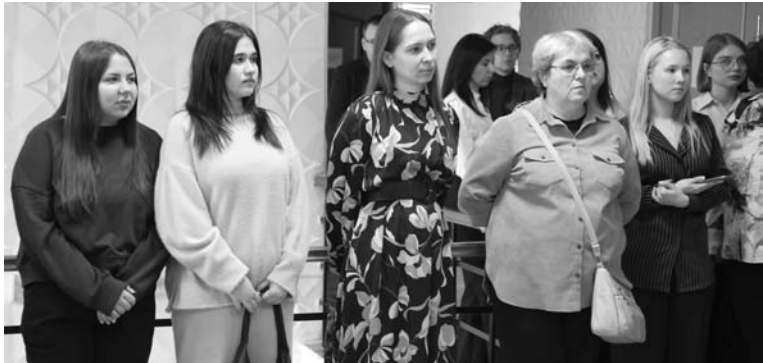
Выставка собрала гостей разных возрастов