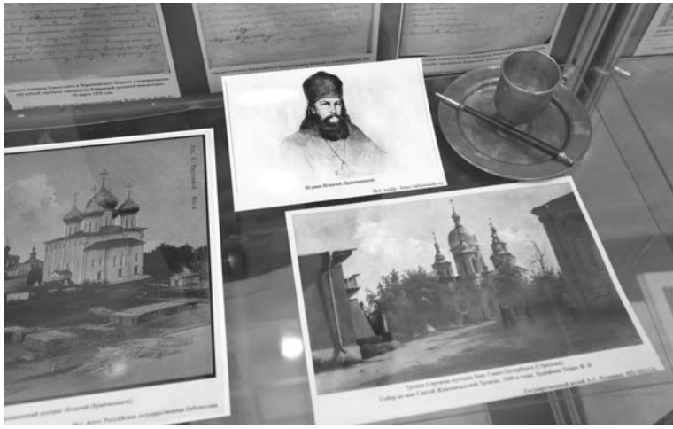
Игумен Игнатий Бренчанинов