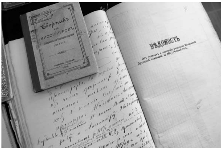
Ведомость успехов Ставропольской семинарии на 1885–86 годы

– Эта икона и была предназначена для Крестного хода. И в конце XIX века они совершались ежегодно – верующие, неся перед собой икону Михаила Тверс-