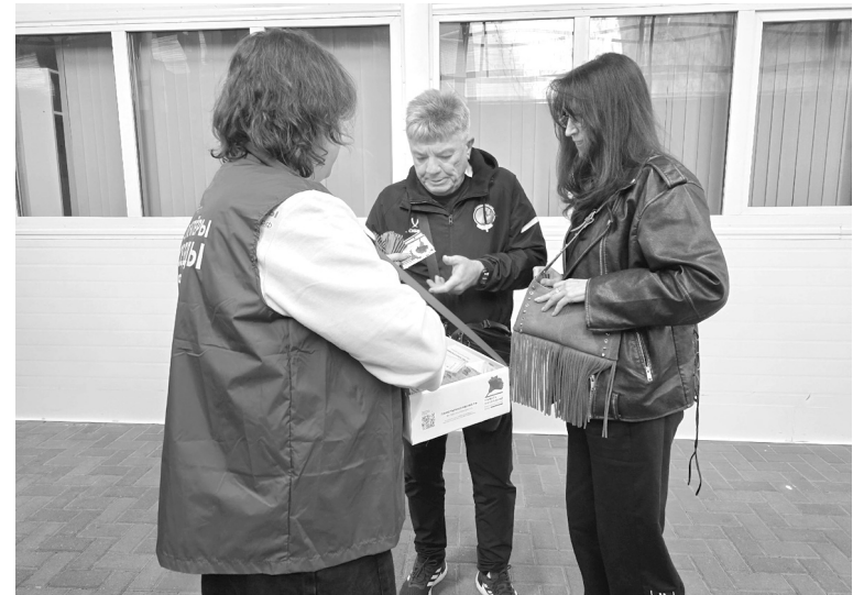
Перед матчем прошли патриотические акции «Красная гвоздика» и «Георгиевская лента»