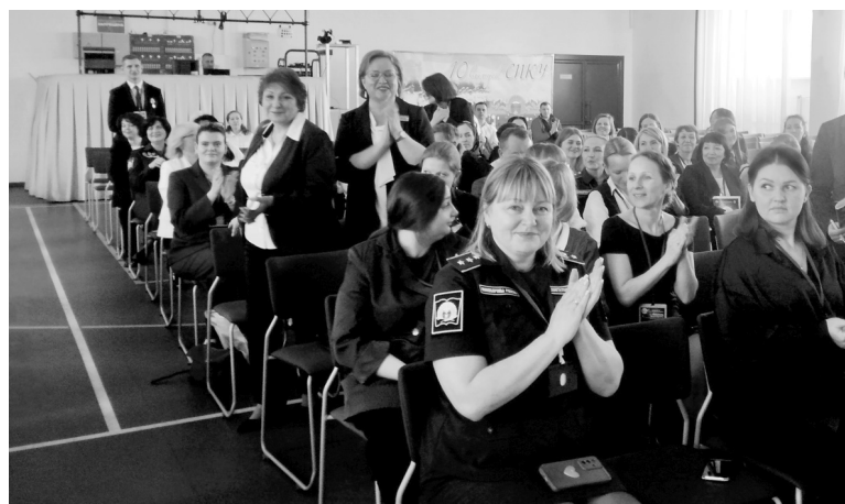
Участники форума приехали из разных уголков России