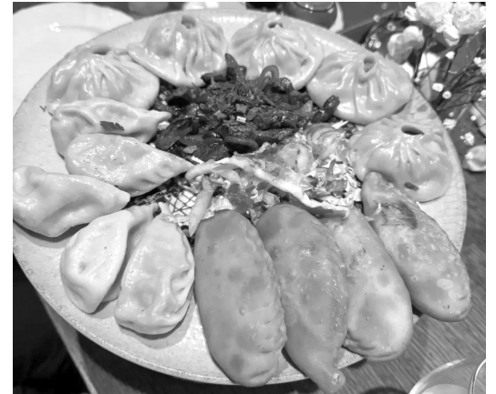
Туристов приглашают угоститься национальными блюдами

Фестиваль является масштабной экологической инициативой, призванной привлечь внимание людей к необходимости сохранения диких тюльпанов. В степях Калмыкии произрастают виды, которые занесены в Красную книгу, а именно: тюльпан двуцветковый, тюльпан Биберштейна и тюльпан