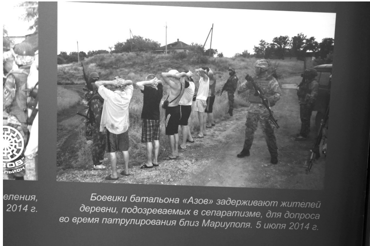
Боевики батальона «Азов» задерживают жителей деревни, подозреваемых в сепаратизме, для допроса во время патрулирования близ Мариуполя. 5 июля 2014 г.