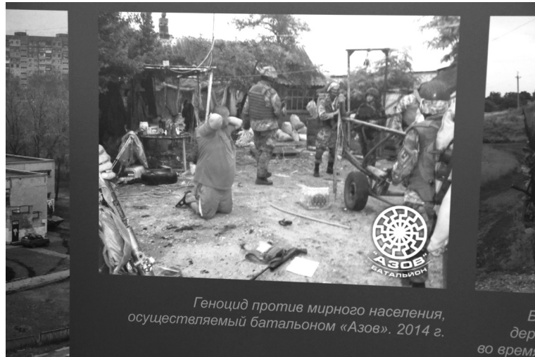
Геноцид против мирного населения, осуществляемый батальоном «Азов». 2014 г.

Факты геноцида местного населения под Мариуполем (июль 2014 года)