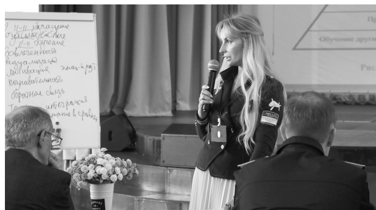
Дискуссионные площадки форума

Здесь обрадовало уважение от этих детей, как кадеты разговаривают, их воспитанность. Это огромная заслуга всего коллектива СПКУ. Смотришь и видишь, что всё-таки наше подрастающее поколение – такие хорошие ребята. Ну и важно то, что мы поделились способами решения воспитательных проблем, много чего для себя взяли, будем реализовывать. У нас обучаются дети военных, и по примеру родителей они дальше идут по этой стезе, в том числе поступают в кадетские и суворовские училища. Немного увидели Ставрополь – очень приятный, чистый город. И жители приветливые. И вы к нам приезжайте в гости, будем рады».