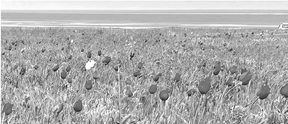
Краснокнижные тюльпаны расцветают каждую весну

больше гостей. Люди приобретают туры, отправляются в путешествие на собственном транспорте всей семьей, потому что действительно есть что посмотреть и попробовать. Насыщенная программа праздника дает возможность не только познакомиться с природой региона, но и погрузиться в культуру калмыцкого народа, узнать об обычаях и традициях. Здесь можно прокатиться на двугорбых верблюдах, проверить свою меткость в стрельбе из лука, насладиться выступлениями творческих коллективов, продегустировать национальную кухню, попробовать разгадать народную калмыцкую головоломку «Нярн шинж» и многое другое. Вопросы, чем себя занять, тут точно не возникнет.