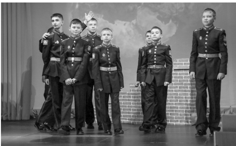
Гости отметили воспитанность ставропольских кадет

«космос» пространство общения, исследований и новых идей. Это стало возможным благодаря поддержке наших партнёров и радушию гостеприимного Ставрополя. Здесь собрались руководители, методисты, преподаватели, воспитатели, психологи – все, кто ежедневно конструирует «космические корабли» детских душ и умов. В век высоких технологий главным ресурсом государства были и остаются образованные кадры. Но если раньше мы говорили о передаче знаний, сегодня задача – зажечь звёзды. Как космос манит человечество неизведанным, так и мы должны увлечь кадет перспективой познания. Нам предстоит обсудить, как воспитать человека будущего, какими компетенциями он должен обладать, чтобы делать «орбитальные свершения» в на-