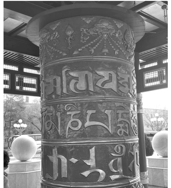
В молитвенном барабане заложено 75 миллионов мантр

Апрель — поистине волшебное время, когда природа начинает играть новыми красками. В бескрайних степях наших южных регионов распускаются тысячи диких тюльпанов, окутывая землю ярким полотном. Красные, желтые, белые соцветия в унисон колышутся под дуновением ветра вплоть до горизонта, завораживая своей красотой и масштабностью. Тюльпаны расцветают на Ставрополье, Кубани, в Волгоградской, Ростовской, Астраханской областях.