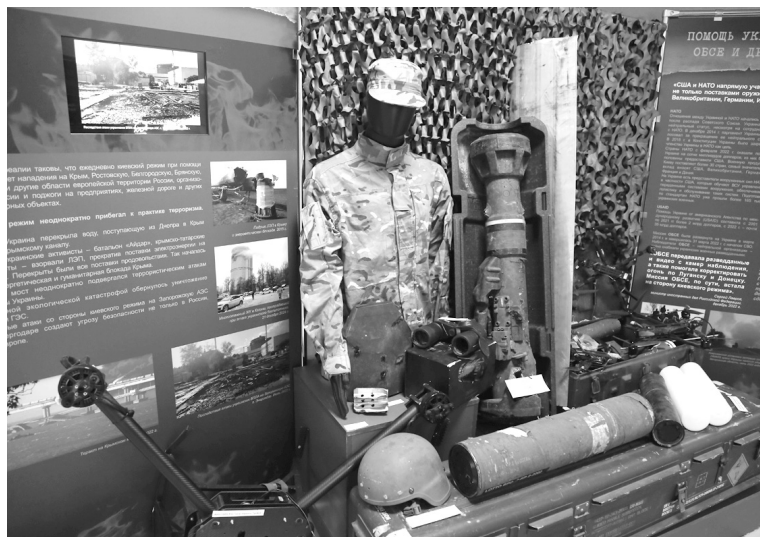
Украинские снаряды и экипировка