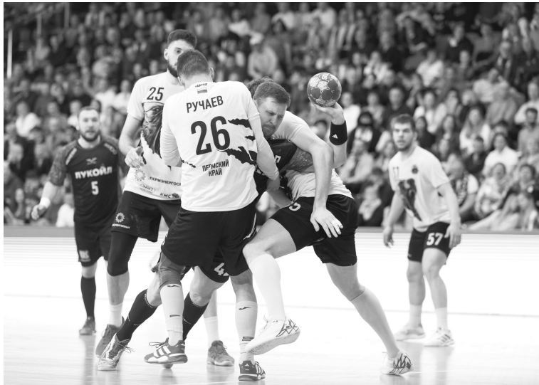
«Викторианцы» попали в капкан «Пермских медведей»