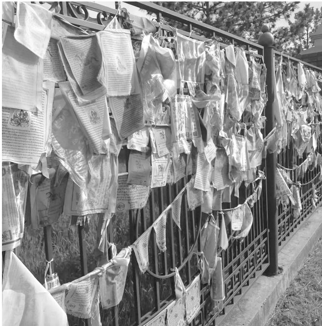
Молитвенные флажки «кони ветра»