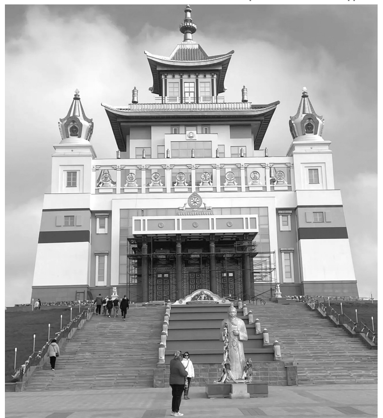
Золотая обитель Будды Шакьямуни

Шренка (Геснера), последний считается одним из древнейших видов.