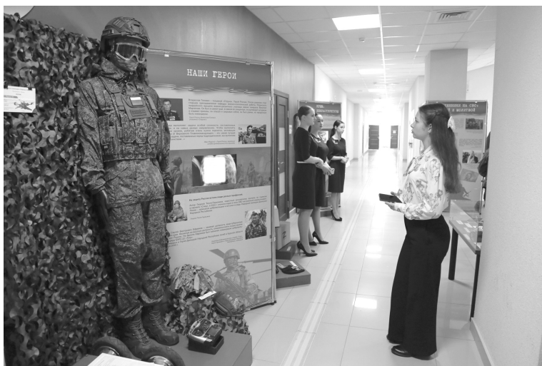
Выставка обращена к молодежи