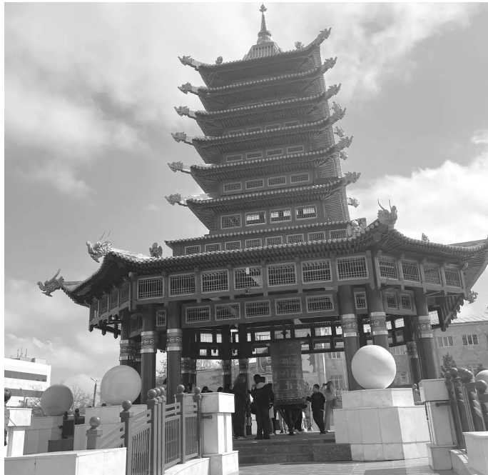
Пагода Семи Дней