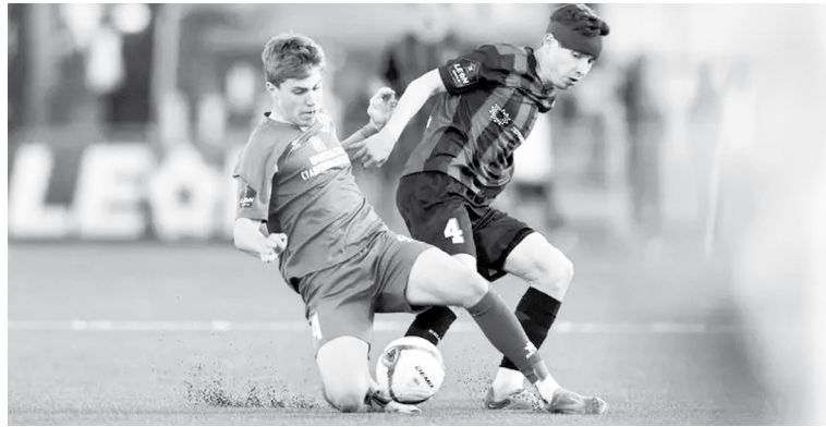
Молодежь «Динамо» отлично показала себя, вступив в игру со скамейки запасных