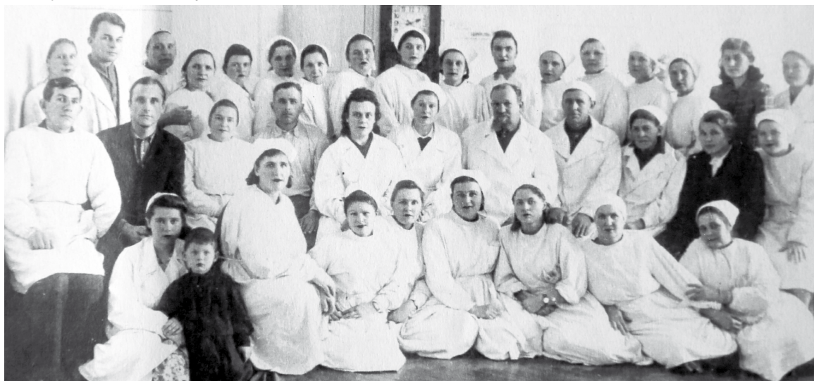
Коллектив Ставропольской физиолечебницы, 1952 год