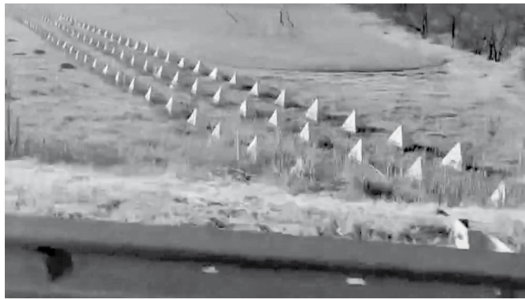
«Зубы дракона» на Дороге жизни

То по одну, то по другую сторону – обгоревшие остовы машин. Сожжены беспилотниками. Тут небо «грязное» или «серое». И даже когда оно чистое, не факт, что «вражеские птички» не появятся. В раскинувшейся вокруг степи (на холмах и небольших возвышенностях) затаились «ждун», невидные глазу. Так наши бойцы прозвали беспилотники, которые маскируются на каком-нибудь возвышении, и «ждун» сидит тихо в ожидании цели. Цель выбирает, естественно, оператор, который может находиться где угодно... Ездить по этой дороге не менее опасно, чем по льду Ладоги в 1943-м. Но она действует, и грузы – гуманитарные и военные –