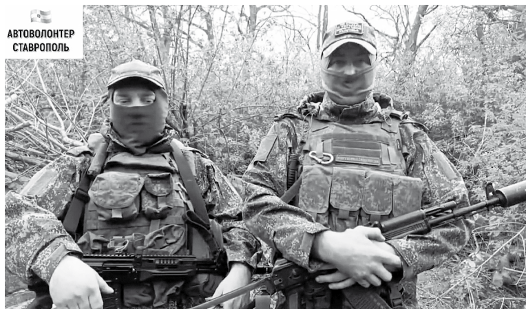
Ставропольских автоволонтеров благодарят морпехи Северного флота