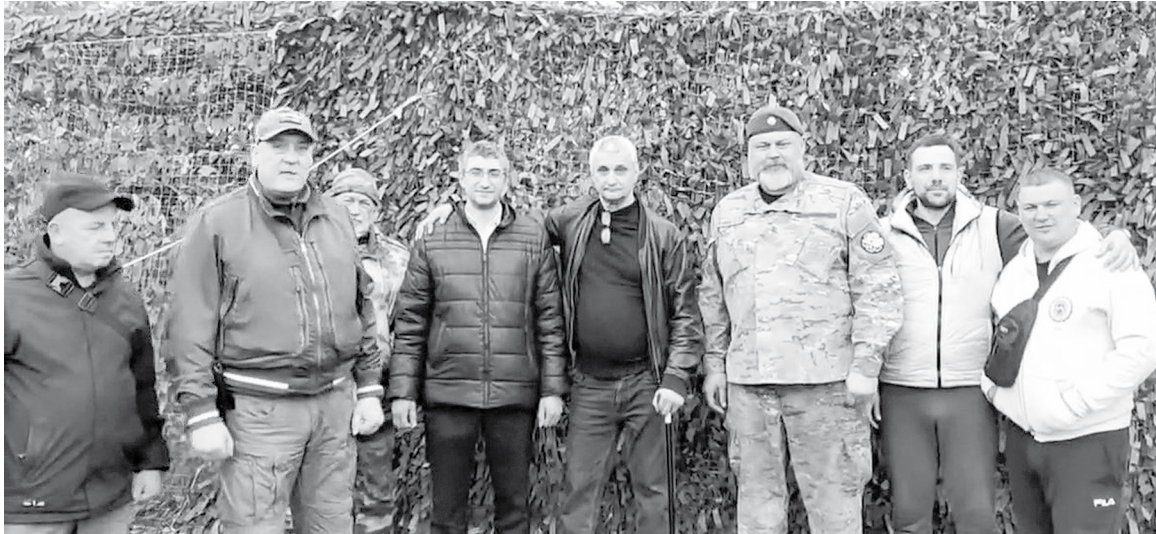
«Автоволонтер-Ставрополь» и «БАРС-11»

Незадолго до Дня Победы ребята из АНО «Автоволонтер-Ставрополь» отвезли на фронт подарки для наших бойцов.