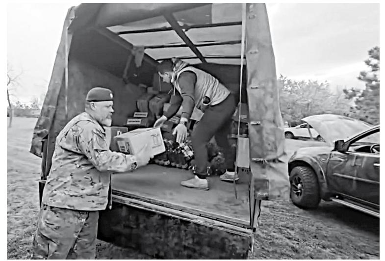
Разгрузка почти завершена

по ней идут постоянно... Поэтому дорогу эту наши бойцы, воюющие на этом направлении, так и зовут – Дорога жизни.