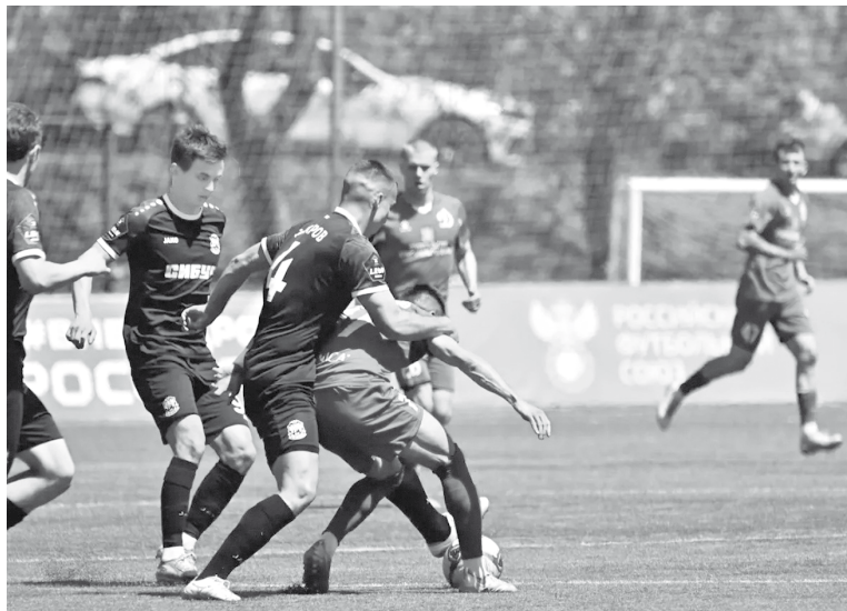
Тюменцы в первом тайме, выиграв много единоборств, сумели переломить ход встречи