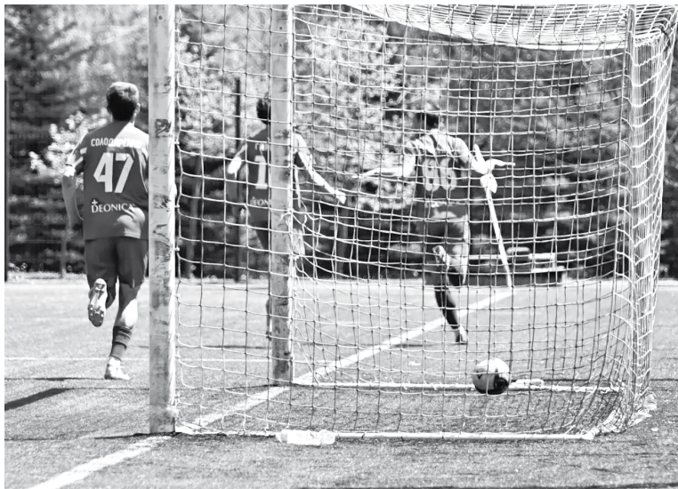
Впервые за месяц ставропольцы забивали первыми в матче