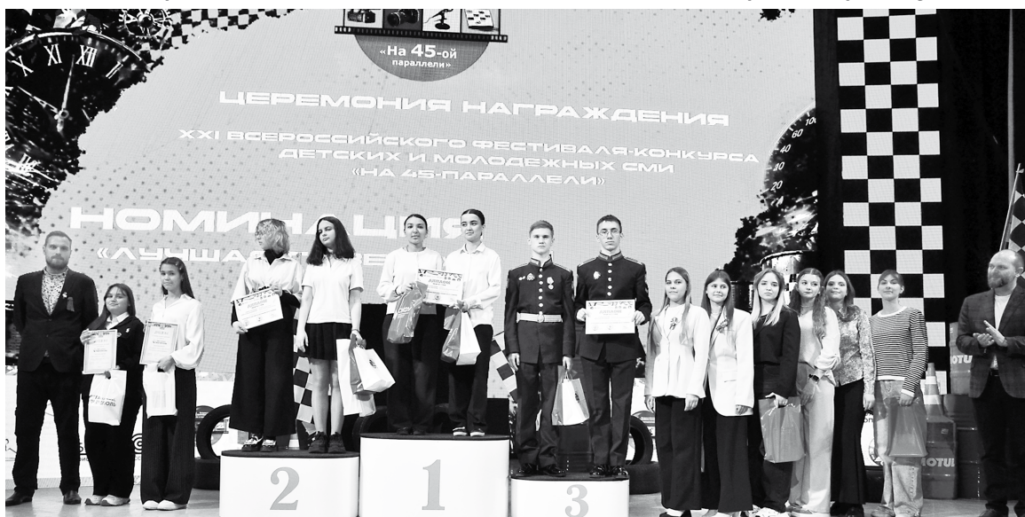
Победители в номинации «Лучшая газета»