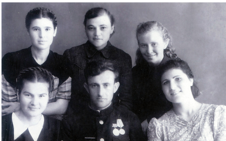
Юный учитель с учениками