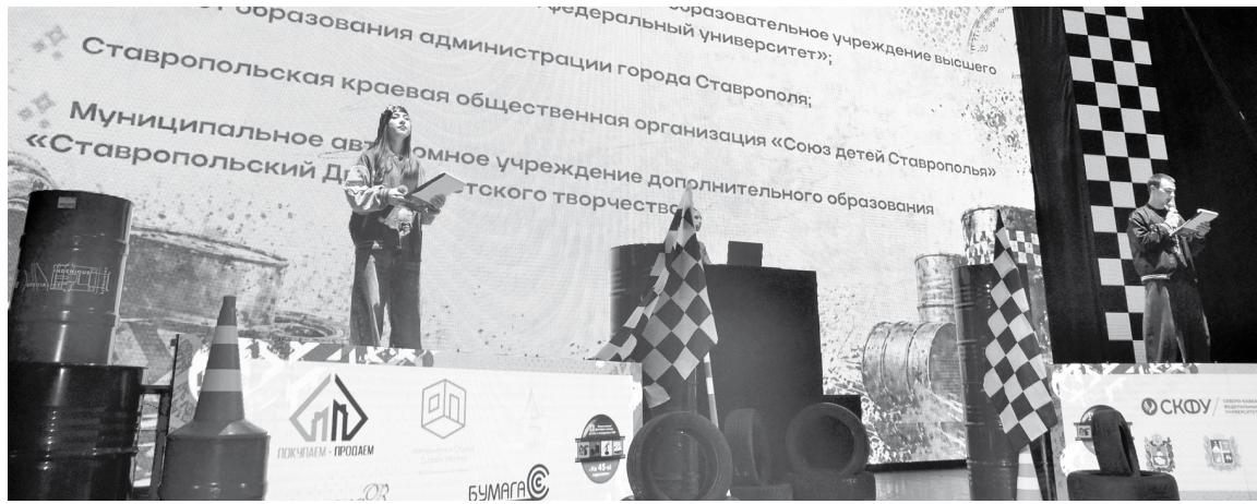
Гоночная церемония открытия

времени. Да и сама борьба за внимание общественности тоже гонка. И тут не получится прийти первым, пройдя весь путь халтурно. Рано или поздно заметят ошибочные данные в тексте, некачественное оформление, неудачную фотокomпозицию, рассинхронизацию видео и звука. Так же и в гонке, в которой вообще нельзя победить, если совершаешь грубые ошибки. Здесь важен единый четкий слаженный механизм.