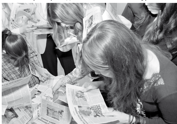
Творческий процесс участников