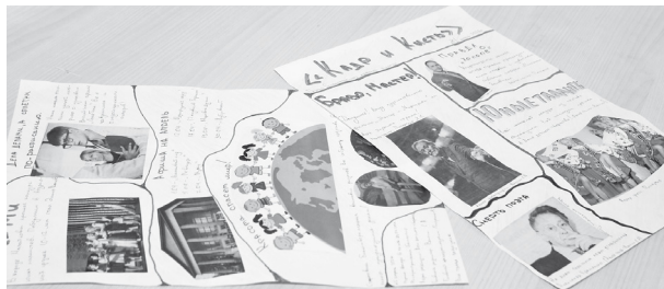
Пример созданной газеты юных журналистов