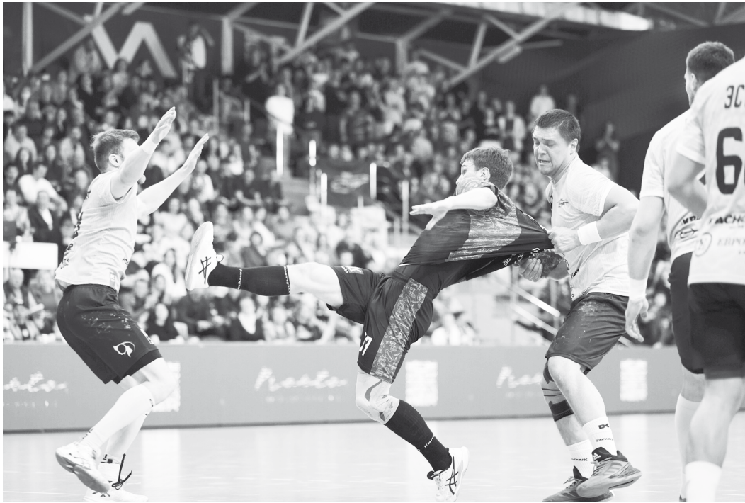
СКИФ пытался всеми способами остановить «Виктор»