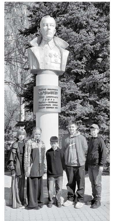
Волжский, площадь имени Карбышева