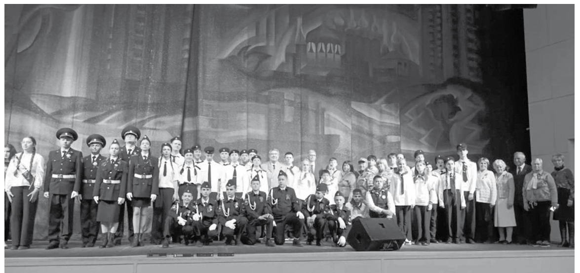
Торжественное открытие фестиваля

На следующий день с карбышевцами встретился внук