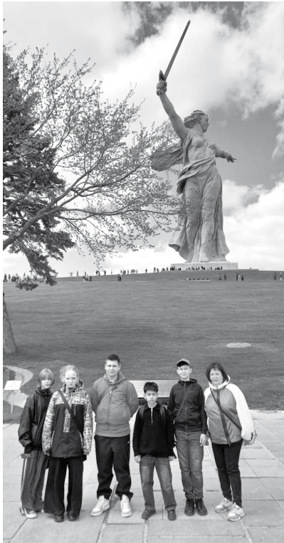
Карбышевцы на Мамаевом кургане