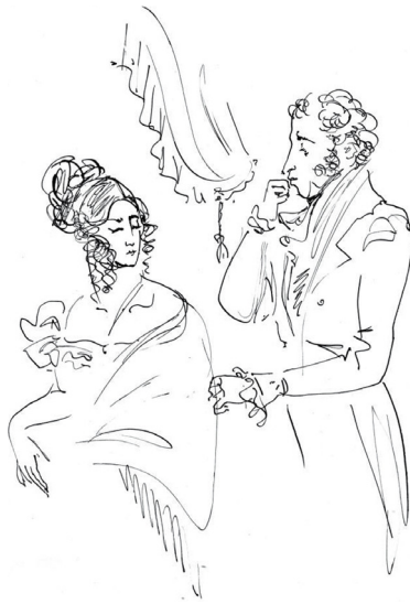
А.С. Пушкин, иллюстрация к роману «Евгений Онегин»

и не ищут Его. Эти безумны и несчастны. Третьи не обрели, но ищут Его. Эти люди разумны, но еще несчастливы.»