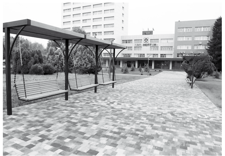
В прошлом году по программе комфортной городской среды благоустроили новый сквер у завода «Нептун»