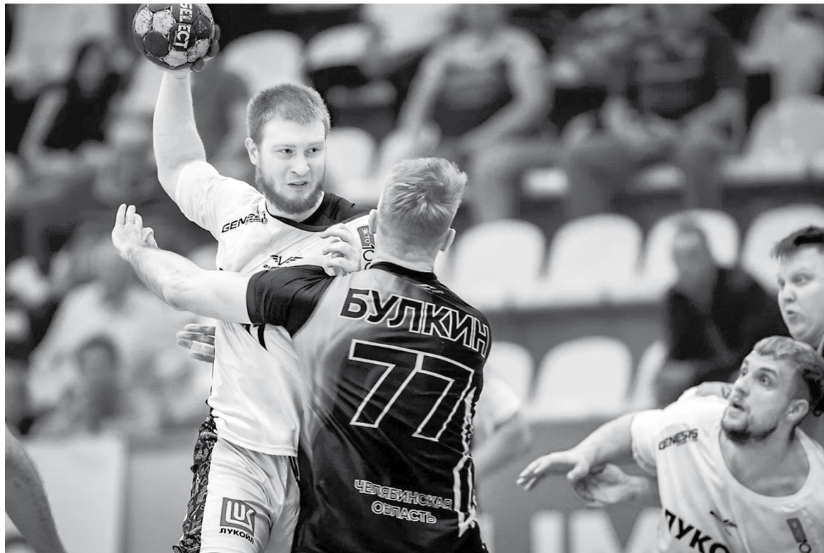
Челябинский коллектив оказался неприступной крепостью для «Виктора» в этом сезоне

счёт был равным – 4:4. Это предвещало не слишком результативную встречу в Снежинске, что не устраивало гостей. Если речь шла об игре регулярного чемпионата, то такой расклад был бы приемлем. Или же преимущество после первого матча оставалось за «Виктором». Гандикап же имели хозяева этой игры, поэтому ставропольским гандболистам ничейный результат был сродни поражению. Хотя отрыв в три мяча и должен отыгрываться без суеты.