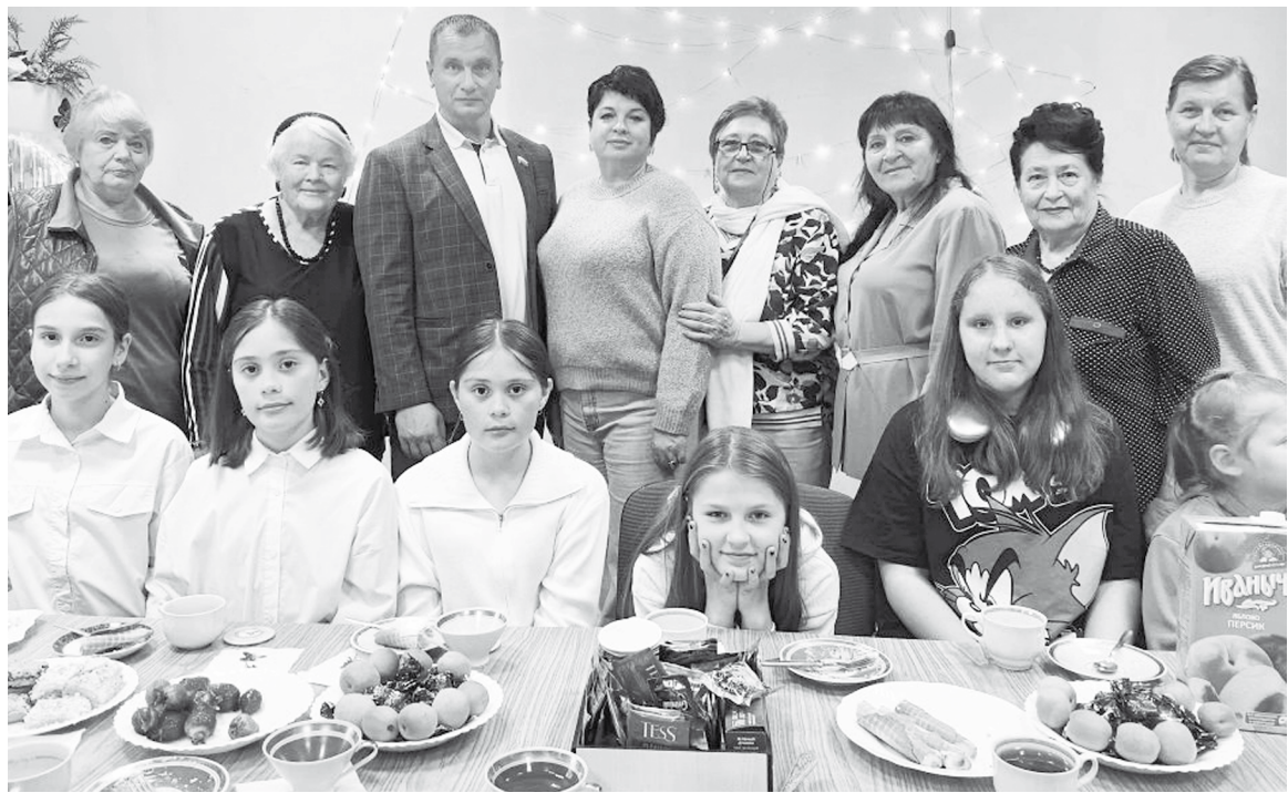
Ученики СОШ №20 с организаторами встречи