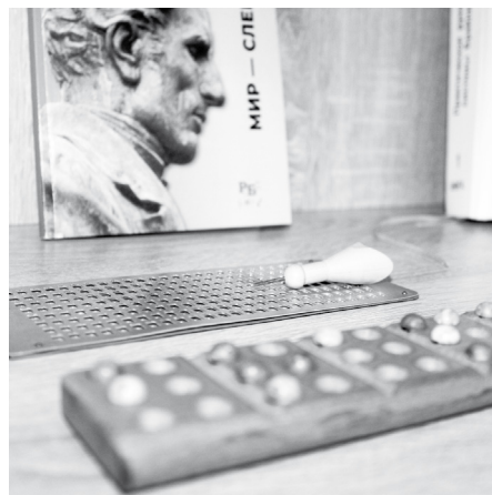
Трафарет и грифель для письма