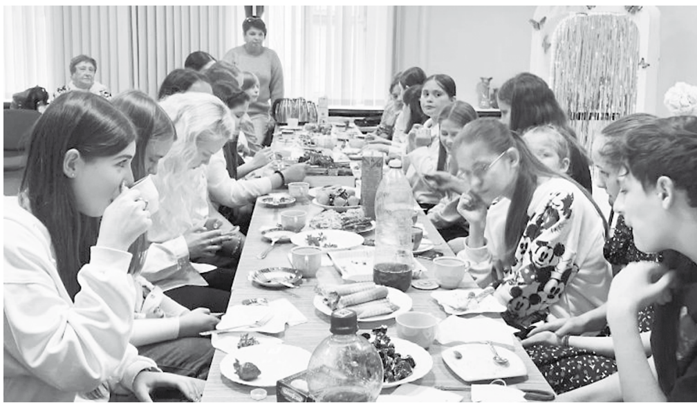
За праздничным столом