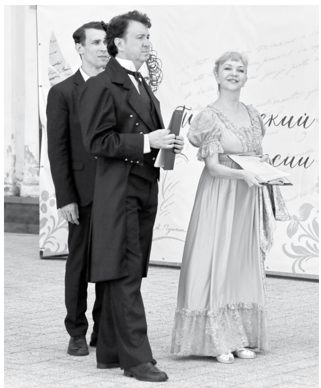
Артисты театра «Гармония»

Одним из культурных событий стал проводимый в рамках «Белой акации» Фестиваль молодых литераторов. Он состоялся на базе МБУК СЦБС. его организаторами стали Союз писателей России, Совет молодых литераторов и министерство культуры Ставропольского края.