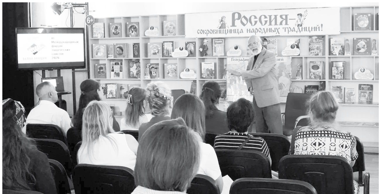
Фестиваль молодых литераторов

В этот день в библиотеке собрались около двадцати молодых писателей, которые подали свои заявки на участие в форуме.