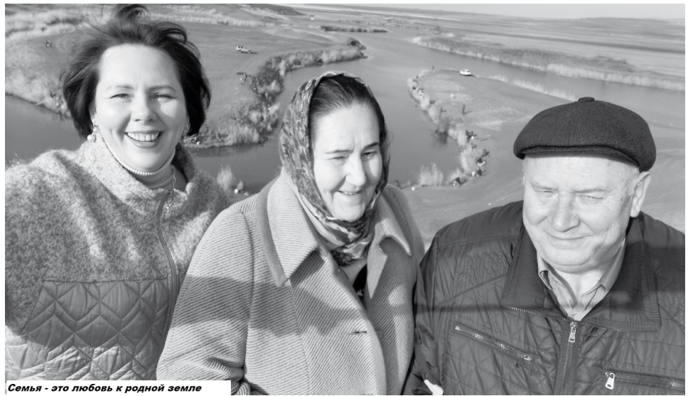
Семья - это любовь к родной земле

года» в номинации «Хранительница семейного очага».