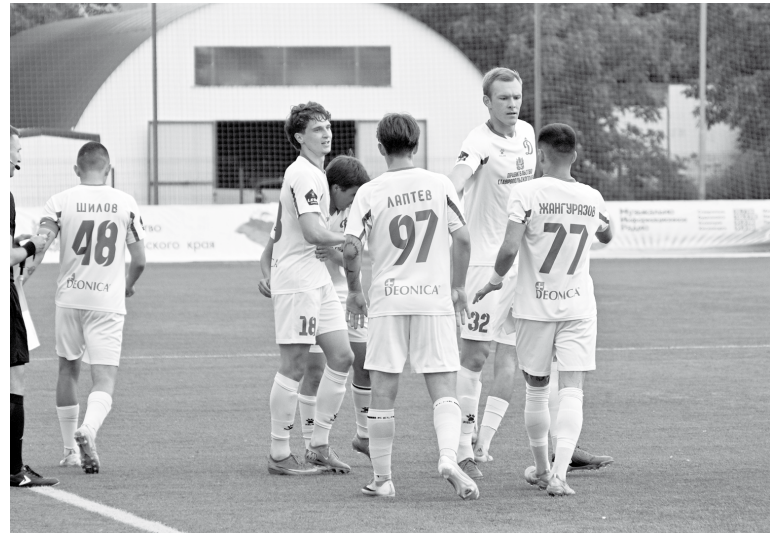
«Динамо» набрали неплохой ход в конце сезона, но этого не хватило для спасения от стыков осенью