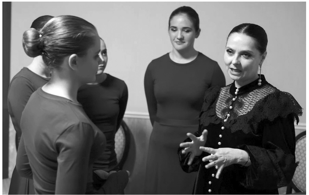
Работа с артистами театра

После Москвы наша героиня вернулась в Ставрополь, где из-за болезни матери было принято решение остаться. В краевой столице поступила в Ставропольский институт имени В.Д. Чурсина по специальности режиссёр телевидения. Казалось, девушке с её артистизмом и внешностью была открыта дорога на голубые экраны. Однако судьба имела на нашу ге-