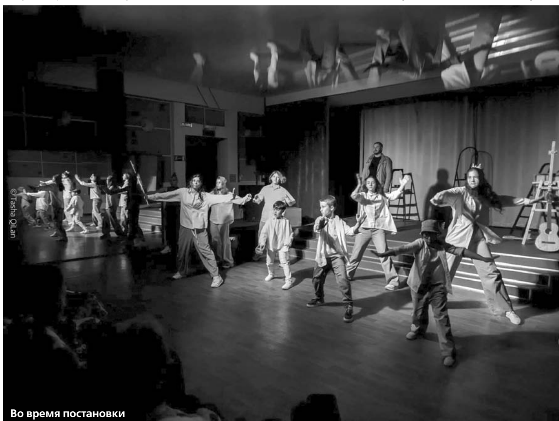
Во время постановки