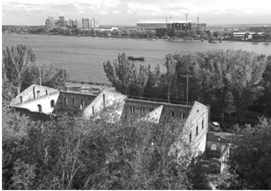
Дон и Парамоновские склады